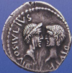
Das Bildnis des Augustus, des Caesar divi filius (des Sohnes eines Gottes), wird dem des divus Iulius (des göttlichen Julius Cäsar) gegenübergestellt. Sesterz Octavians, um 40 v. Chr., Vor- und Rückseite (oben) und ein Denar Octavians von 38 v. Chr. (links).

© Münzen & Medaillen AG, Basel, Auktion 43, 1970, Nr. 258/Münzen & Medaillen AG, Basel, Auktion 66, 499 (1:2)