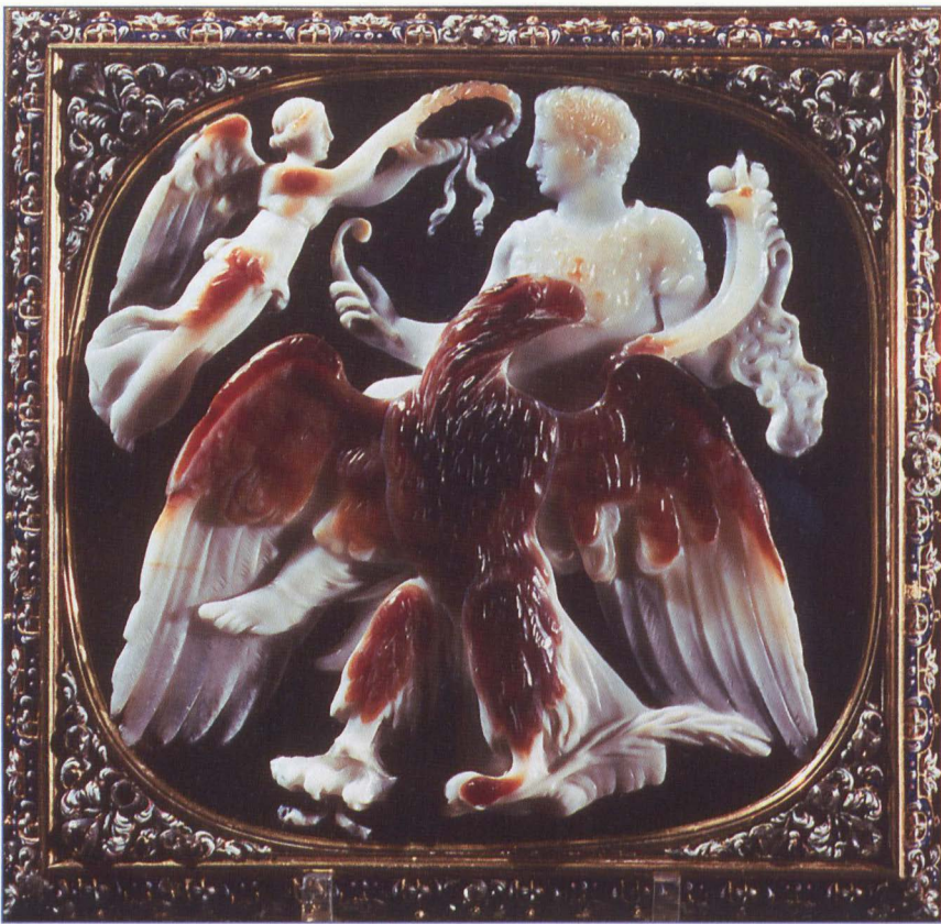
Apotheose des Kaisers Claudius. Entstanden nach seinem Tod 54 n. Chr. Auf Adlerflügeln wird er entrückt. Der Adler ist das Symboltier für Zeus.

zugeschrieben und von ihnen erwartet wird, durch menschliche Instanzen erfahrbar, wird diesen im Umkehrschluss auch der entsprechende Dank angeboten, eben kultische Ehrung.