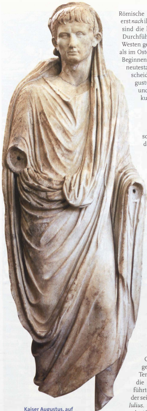
Kaiser Augustus, auf dessen Betreiben sein Vorgänger Cäsar zum Gott wurde – nicht ohne den Hintergedanken, dass es ihm ähnlich ergehen sollte ...

Römische Kaiser werden im Normalfall erst nach ihrem Tod divinisiert. Außerdem sind die kultischen und zeremoniellen Durchführungen des Kaiserkultes im Westen gewöhnlich viel zurückhaltender als im Osten. Wir müssen differenzieren. Beginnen wir im Westen an dem für die neutestamentliche Zeitgeschichte entscheidenden Punkt, mit Kaiser Augustus, bevor wir uns dem Osten und der Vorgeschichte des Kaiserkults zuwenden.