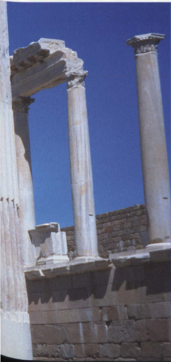
Unten: Rekonstruktionen des Traianaeums. Im Zentrum der Kaisertempel. Oben: Blick vom Tal aus.

Nun ist Caligula – Gott sei Dank – nicht der Normalfall unter den römischen Kaisern. Er geht weit darüber hinaus, was seine Vorgänger Augustus und Tiberius, oder auch die meisten seiner Nachfolger, etwa Claudius, Vespasian oder Titus, gefordert hatten. Auch in römischen Augen hat sich Caligula nach einem offensichtlich hoffnungsvollen Herrschaftsbeginn, vielleicht nach seiner Krankheit im Jahr 37, geradezu