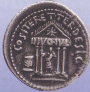
Der Aureus Octavians, 36 v. Chr., zeigt den Tempel des divus Iulius noch vor seiner Erbauung. Im Tempel das Kultbild mit dem Augurstag, im Giebel das sidus Iulium , daneben der Memorialaltar, der an den Ort der Verbrennung von Cäsars Leiche erinnerte. © Slg. Walter Niggeler Nr 1001, (1:2)