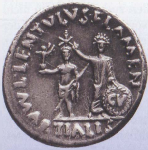
Denar des L. Lentulus, Rom 12 v. Chr. Augustus (mit dem clipeus virtutis , seinem Ehrenschild, verliehen 27 v. Chr.) setzt einer Statue des göttlichen Cäsar den Stern auf: Erinnerung an das Erscheinen des sidus Iulium im Jahr 44 v. Chr., eines Kometen, den man mit dem Tod und der Gottwerdung Cäsars verband. 1055 (1:2)