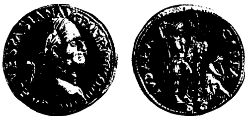
Judaea capta-Sesterz, geprägt unter Vespasian, Rom, 71 n. Chr., Staatliche Münzsammlung München Vorderseite: Kopf des Vespasian mit Lorbeerkranz und Kaisertitulatur: IMP(erator) CAES(ar) VESPASIAN AVG(ustus) Rückseite: IVDAEA CAPTA; in der Mitte Palmbaum, links Vespasian im Militärgewand mit Lanze und Dolch, den Fuß auf den Helm gesetzt; rechts die trauernde Personifikation der Judäa auf einem Waffenhaufen

(3) der Einschnitt durch einen entscheidenden militärischen Sieg und die Ausschaltung alter Feinde bewirkt wird. Für Vespasian wurde die Niederschlagung des jüdischen Aufstandes durch Münzprägungen, die jedermann verkündeten: Judaea capta , entsprechend stilisiert.