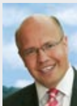
Peter Altmaier, Parlamentarischer Staatssekretär beim Bundesminister des Innern

Geboren am 24. November 1948 in Zwickau (Sachsen), Agrarwissenschaftler. www.bergner.de