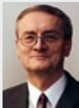
Dr. August Hanning, Staatssekretär im Bundesministerium des Innern

Geboren am 16. Februar 1946 in Nordwalde (Westfalen), Jurist.