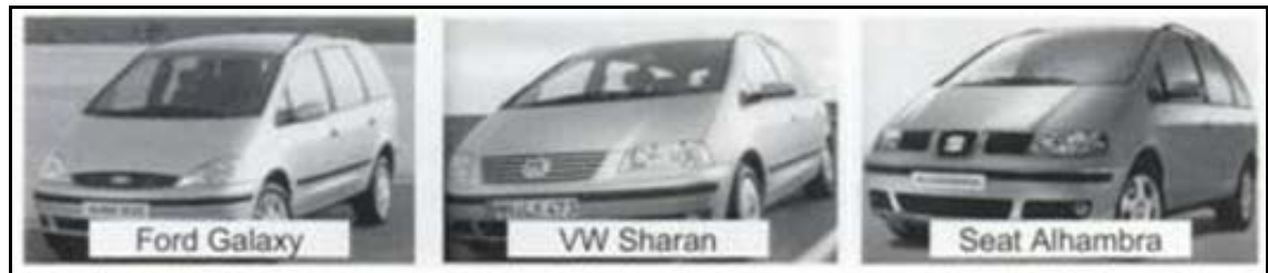
Abbildung 1: Ford Galaxy, VW Sharan und Seat Alhambra im Vergleich

„Brands have run out of juice. More and more people in the world have grown to expect great performance from products, services and experiences. And most often, we get it. Cars start first time, fries are always crisp, dishes shine.“ 1 Produkte gleichen sich aus Kundensicht in ihren technisch-funktionalen Eigenschaften immer mehr an und mutieren zu austauschbaren Massenmarken. Esch (2008, S. 12) führt hierzu ein Beispiel aus der Automobilindustrie an (vgl. Abbildung 1). 2