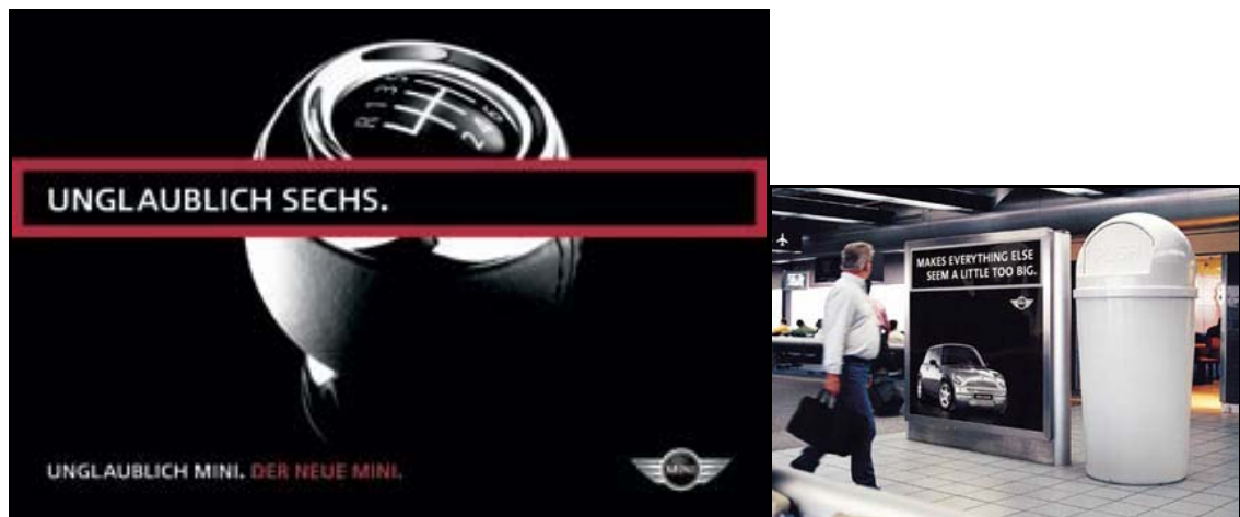
Abbildung 9: Typische Elemente der MINI CI mit Wiedererkennungswert

frischend.“ Diese Elemente der MINI Corporate Identity erlauben eine hohe Wiedererkennbarkeit (vgl. Abbildung 9).