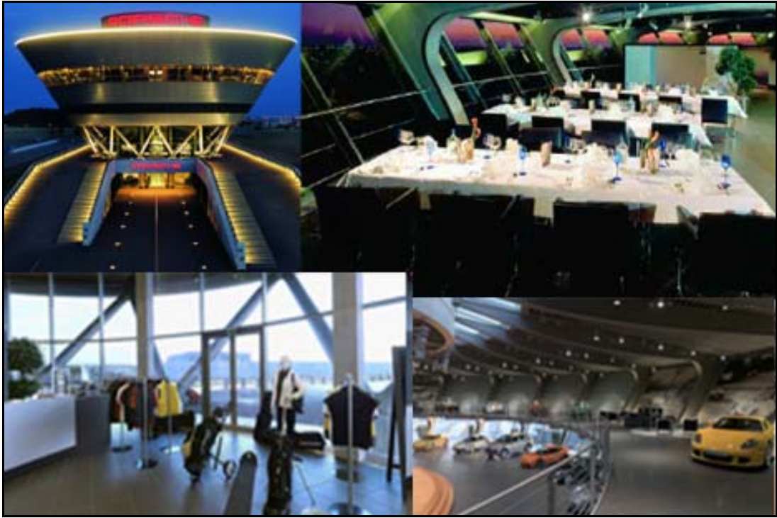
Abbildung 3: Porsche Kundenzentrum

Was Binder (2008, S. 184) als Storyline bezeichnet, lässt sich auch in der Architektur des Produktionsbereichs wieder finden. Das „konsistente Bild der Marke in der Wahrnehmung der Besucher“ 94 äußert sich auch hier. Der Boden der Werkshalle ist sauber und scheint sogar zu glänzen. In dem technisch hochwertigen Produktionsbereich kann der Cayenne oder Panamera von der „Motorenvormontage bis zum Fahrzeugfinish durch die Fertigung“ begleitet werden. Der Besucher kann von außen beobachten, wie die Ingenieure und Mechaniker mit größter Konzentration und Sorgfalt die Rennsporttechnik zusammensetzen (vgl. Abbildung 4).