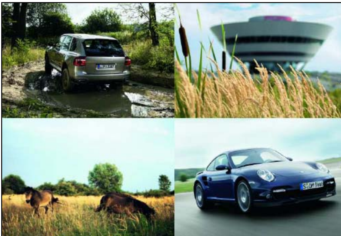
Abbildung 5: Teststrecke

An dieser Stelle soll dem Besucher beispielhaft verdeutlicht werden, wie Umweltschutz im Unternehmen betrieben wird. In der Wahrnehmung des Besuchers sind BL und Unternehmen eins. 96 Folglich muss das BL eine inhaltlich und individuell auf das Unternehmen zugeschnittene Struktur besitzen und authentisch wirken. 97