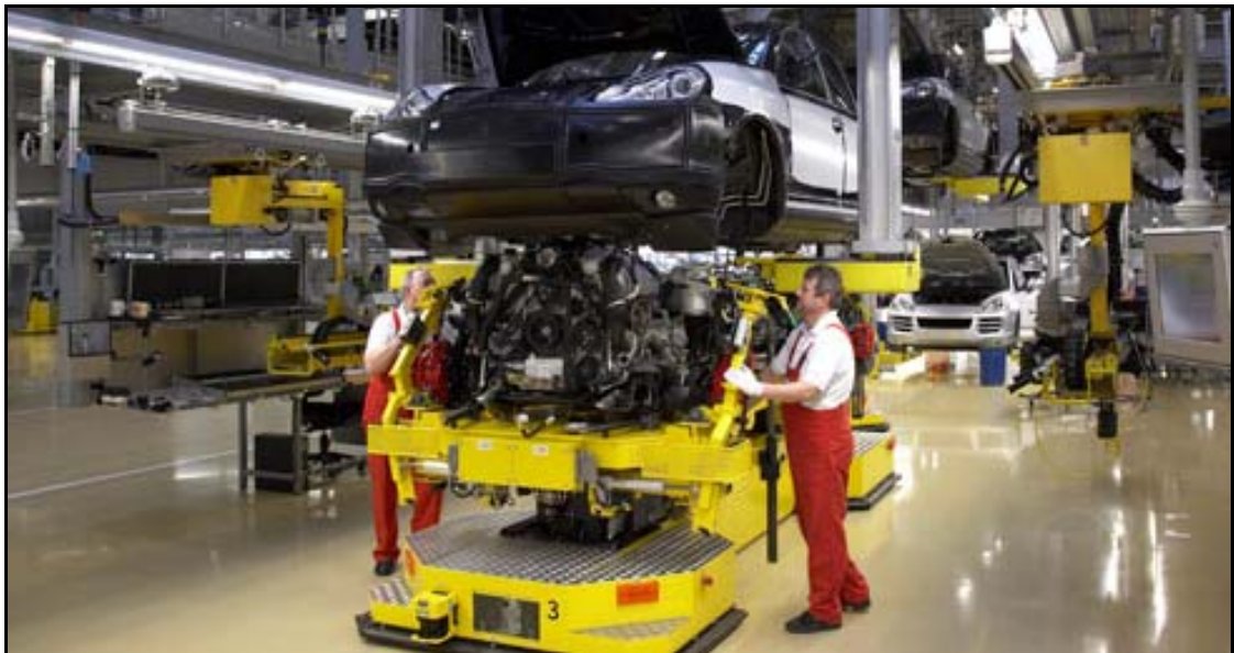
Abbildung 4: Produktion

An dieser Stelle soll dem Besucher beispielhaft verdeutlicht werden, wie Umweltschutz im Unternehmen betrieben wird. In der Wahrnehmung des Besuchers sind BL und Unternehmen eins. 96 Folglich muss das BL eine inhaltlich und individuell auf das Unternehmen zugeschnittene Struktur besitzen und authentisch wirken. 97