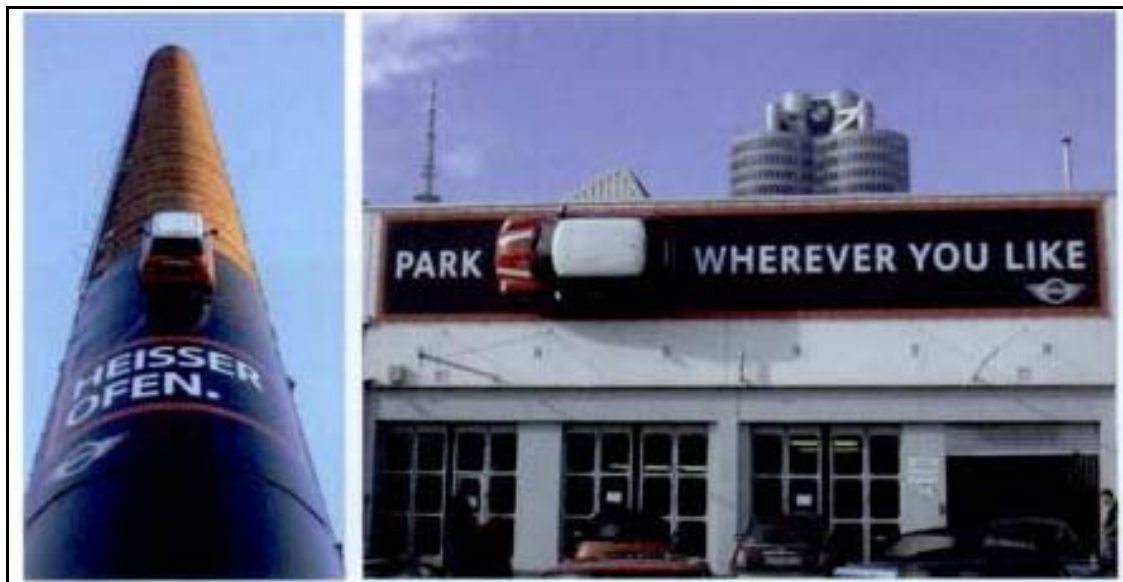
Abbildung 10: MINI Fiberglas Modell 133

Events als Erlebnistreiber sind ein weiterer wichtiger Baustein bei MINI . So wurde z. B. das Konzept MINI at In-Spots entwickelt. Bei diesen Events wird ein neues MINI Modell in den angesagtesten Clubs der bedeutenden internationalen Metropolen vorgestellt. 131 Modenschauen, Konzerte, Stunt-Shows, Promi Kochshows und Charity Veranstaltungen runden das Markenerlebnis ab. 132 Daneben sind Guerilla-Aktionen ein zentraler Erlebnistreiber. So platzierte MINI in einer an vielen außergewöhnlichen Orten ein Modell aus Fiberglas (Abbildung 10).