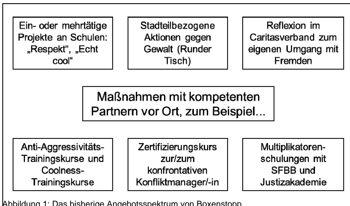
Abbildung 1: Das bisherige Angebotspektrum von Boxenstopp