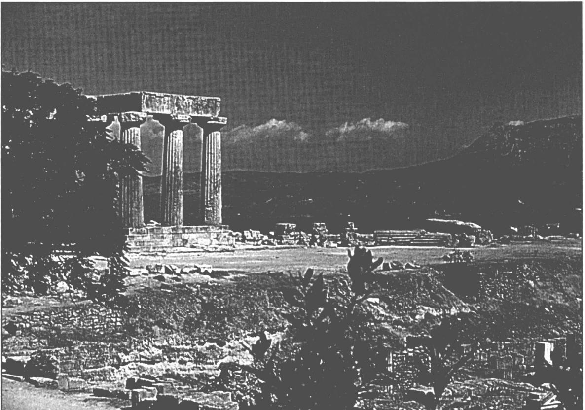
Korinth, für Paulus eine wichtige Hafenstadt und Schauplatz pastoraler und theologischer Auseinandersetzungen

Dabei wurde unsere Reise etwas ganz anderes als eine paulinische „Heiligtumsfahrt“. Es ging nicht darum, ob eine bestimmte Orts- tradition „Recht“ hat, wenn sie behauptet: „Paulus war hier“. Vielmehr wurde einerseits Paulus ein Weggefährte zu den Stätten der klassischen Antike, andererseits erwiesen sich die unterschiedlichen Orte und Landschaften