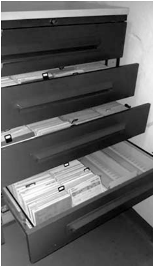
Abb. 1: Pfarrkartei (in Verwendung bis 2008)

„Hirtenspiegel“ vielen kaum bekannt sein dürfte: der Karteikasten der Pfarrei. Er ist die Grundlage einer seelsorglichen Arbeit des 19. Jahrhunderts im Bereich der Großstadtpastoral, die aufgrund der Migrationsbewegungen kaum noch persönliche Vertrautheit der Pfarrer mit den Pfarreimitgliedern erlaubte. Massiv angewachsene Großpfarreien und die Mitarbeit mehrerer Priester (vor allem Kapläne) in einer Pfarrei erforderten nicht nur die territoriale Strukturierung von „Besuchsbezirken“ 28 , sondern auch eine technische Form der Wissensverwaltung. Der damit entstehende Zettelkasten kann neben dem moralisch-disziplinierenden Instrument der „Hirtenspiegel“ als zweites, unscheinbares Symbol der Pastoralmacht und als Werkzeug des gemeindlichen, in Hausbesuchen erhobenen, Herrschaftswissens gelten.