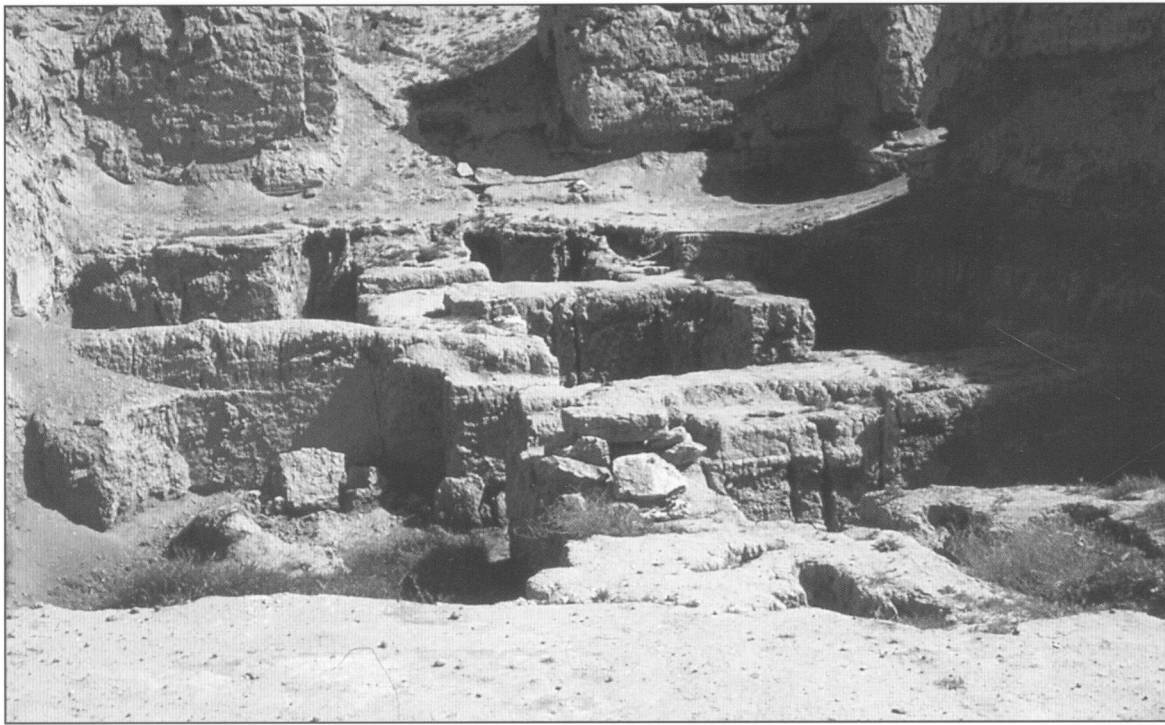
Ausgrabung in Mari, Bibliothek im Palast des Königs Zimrilim (1717-1695 v. Chr.), in der die Archäologen unter 25 000 Tafeln auch jene mit den prophetischen Sprüche gefunden haben.