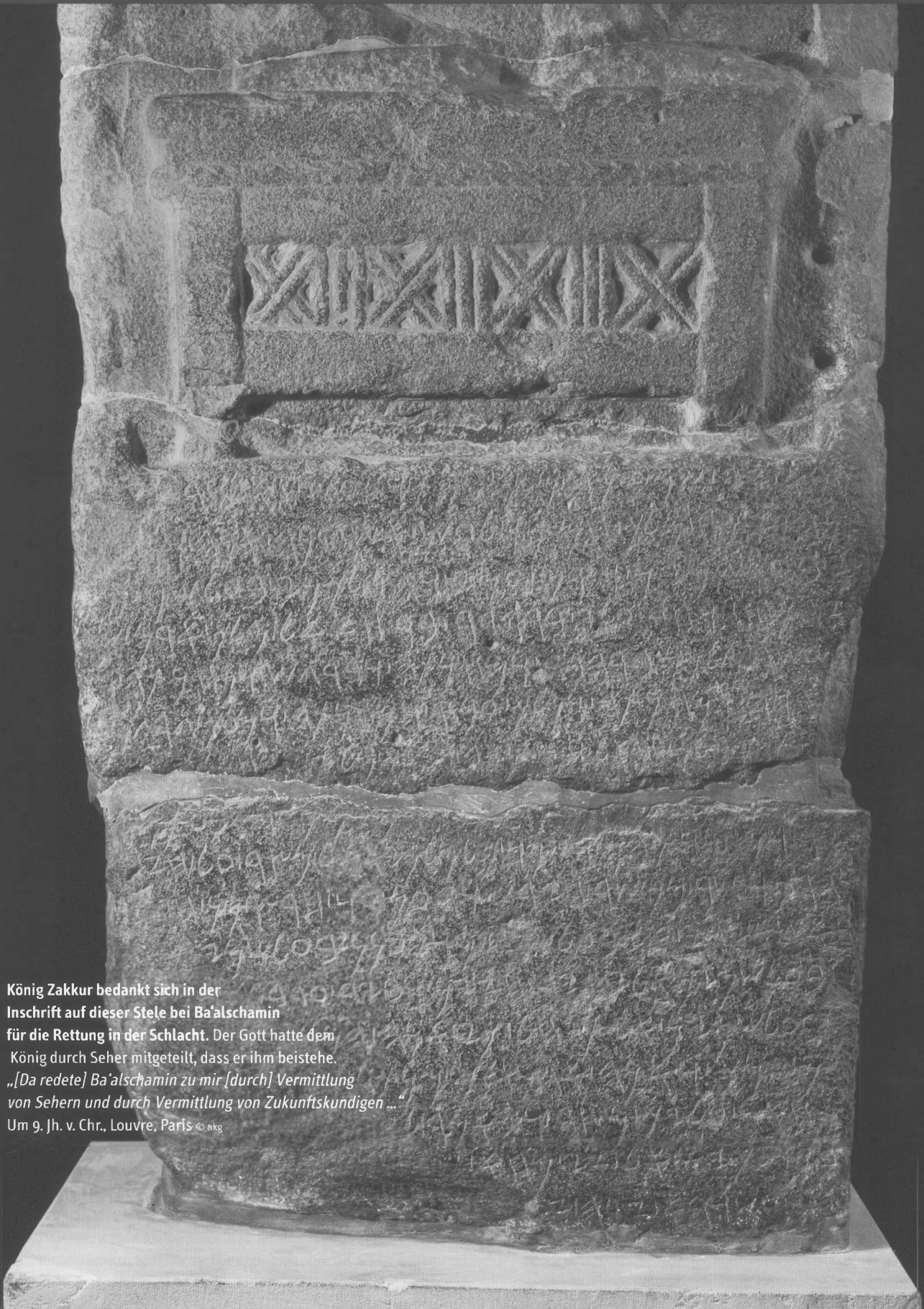
König Zakkur bedankt sich in der Inscription auf dieser Stele bei Ba'alschamin für die Rettung in der Schlacht. Der Gott hatte dem König durch Seher mitgeteilt, dass er ihm beistehe. „[Da redete] Ba'alschamin zu mir [durch] Vermittlung von Sehern und durch Vermittlung von Zukunftskundigen ...“ Um 9. Jh. v. Chr., Louvre, Paris