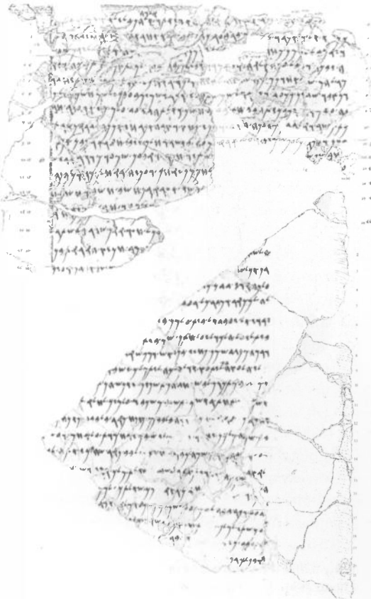
Faksimile der Bileam- Inschrift: „Schrift des Balaam, des Sohnes Beors, des Mannes, der die Götter sah“.

Der Bileamsspruch hat besonders wegen der folgenden Passage eine Wirkungsgeschichte im Christentum: