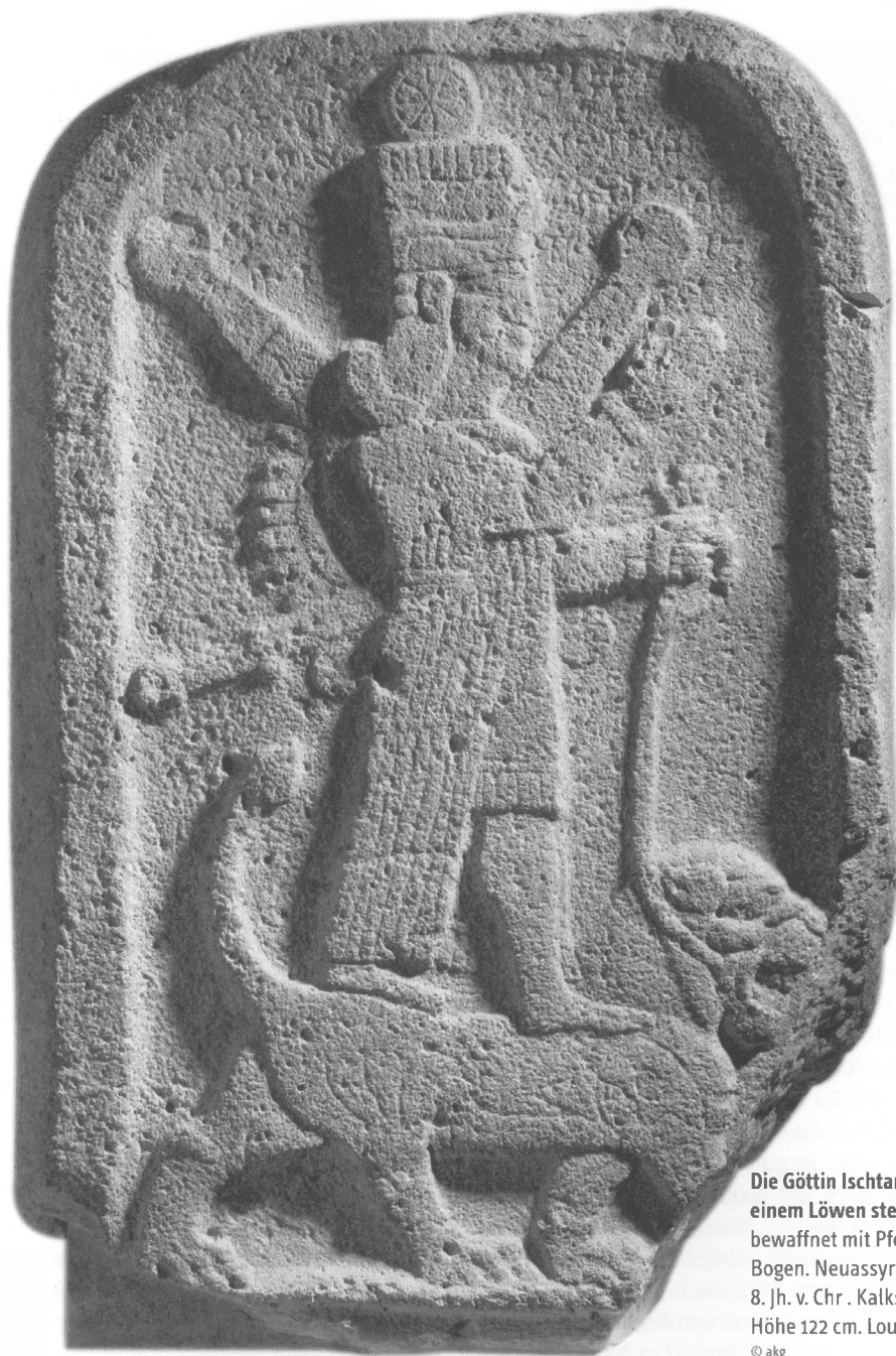
Die Göttin Ishtar auf einem Löwen stehend, bewaffnet mit Pfeil und Bogen. Neuassyrisch, 8. Jh. v. Chr. Kalkstein, Höhe 122 cm. Louvre, Paris.