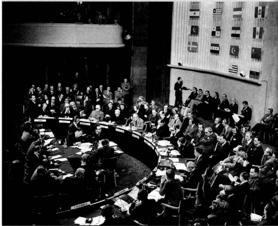
DIE UN-VOLLVERSAMMLUNG VERABSCHIEDET AM 10. DEZEMBER 1948 IM PALAIS DE CHAILLOT IN PARIS DIE ALLGEMEINE ERKLÄRUNG DER MENSCHENRECHTE.

Die Idee der Menschenrechte hat Vorläufer, die bis in das Naturrechtsdenken der griechischen Philosophie und das frühe Christentum zurückreichen. In der Form von Bürgerrechten erlangten sie im Europa der sich herausbildenden absolutistischen Territorialstaaten konkrete politische Bedeutung. Als Reak-