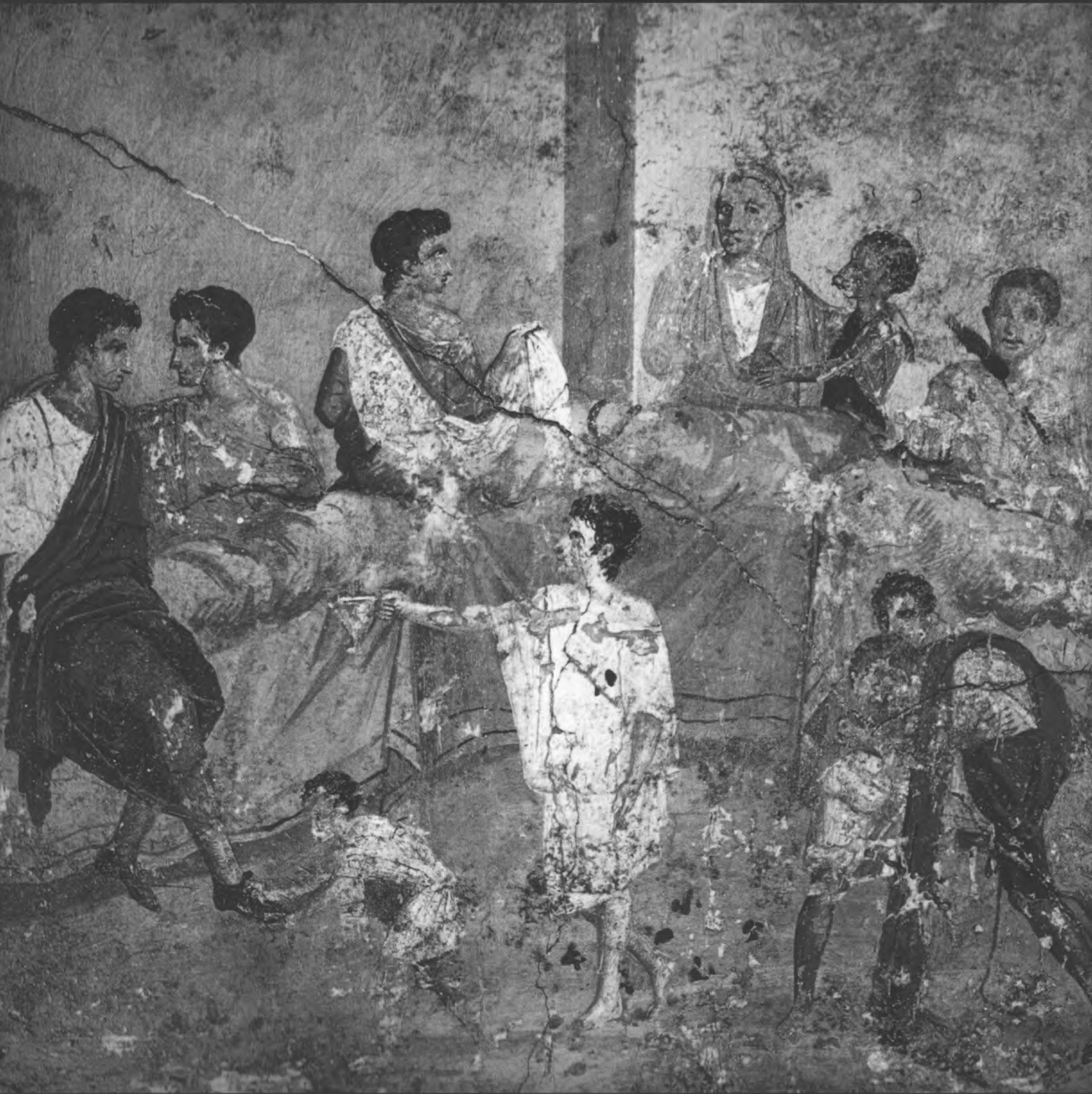
Bankett mit mehreren Generationen. Fresko auf einer Wand in Pompeji, 1. Jh. nC.