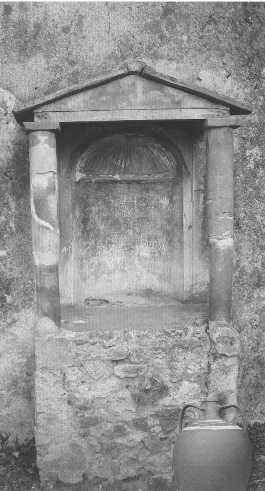
Lararium in Pompeji. An solchen Hausaltären wurden im Rahmen von Mahlfeiern den Haus- und Schutzgöttern (Laren und Penaten) Räucher-, Trank- und Speiseopfer dargebracht.

wieder tat: Kommunikation mit Göttern, Geistern oder gottähnlichen Verstorbenen. Mitunter spielte dabei das Essen eine Rolle.