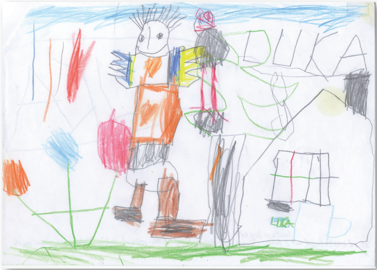
Der Engel vor Josefs Haus. (Von Peter gemalt)