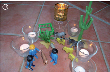
13 Lk.: Die Engel verkünden den Hirten die Geburt Jesu.