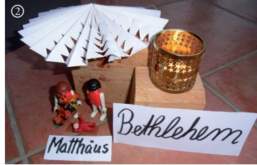
Mt.: Ein heller Stern weist auf Jesu Geburt hin.