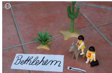
12 Lk.: Josef und die schwangere Maria auf dem Weg.