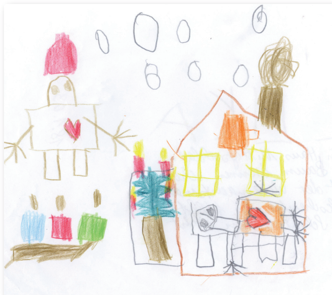
Tante Luise als Christkind. (Von Peter gemalt)