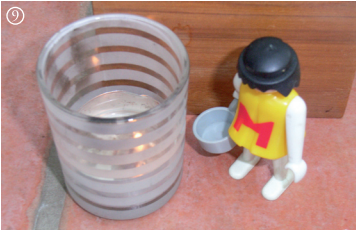
9 Lk.: Ein Engel verheißt Maria die Schwangerschaft.