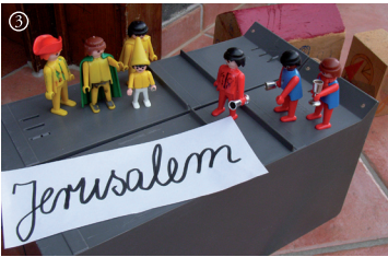
Mt.: Drei Weise fragen bei Herodes nach dem neugeborenen König.