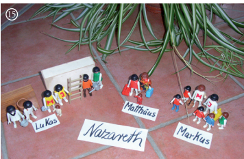
15 Jesu Familie in N., Mk., Mt. und Lk. erzählen verschieden dazu.