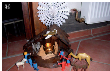
16 Krippenensemble mit Weisen, Hirten und Ochs und Eseln.