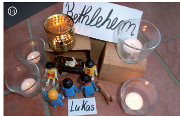
14 Lk.: Die Hirten finden Stall, Krippe und Jesuskind.