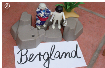
Lk.: Zacharias und Elisabeth sind alt und kinderlos.