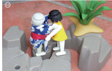
10 Lk.: Maria und Elisabeth begegnen sich, beide schwanger.