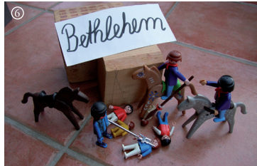
Mt.: Kindermord von Bethlehem.