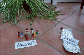
Mk.: Jesus mit Eltern und Geschwistern und Johannes am Jordan.