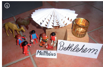
Mt.: Die drei Weisen ehren und beschenken das Jesuskind.