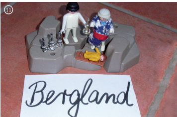
11 Lk.: Zacharias und Elisabeth mit dem neugeborenen Johannes.