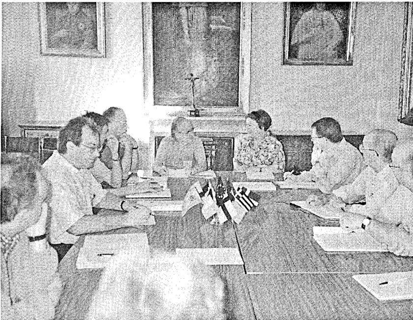
Begegnung: Deutschsprachige Arbeitsgruppe

Überläßt man sich der Weisheit der griechischen Mythologie, dann steht am vorzeitlichen Beginn Europas eine phönikische Prinzessin, die zum Opfer göttlicher Allmachts- und Sexualphantasien wurde: Zeus, listig zum Stier mutiert, entführte das Mädchen Europa nach Kreta, um es sodann zu vergewaltigen. Der italienische Schriftsteller Roberto