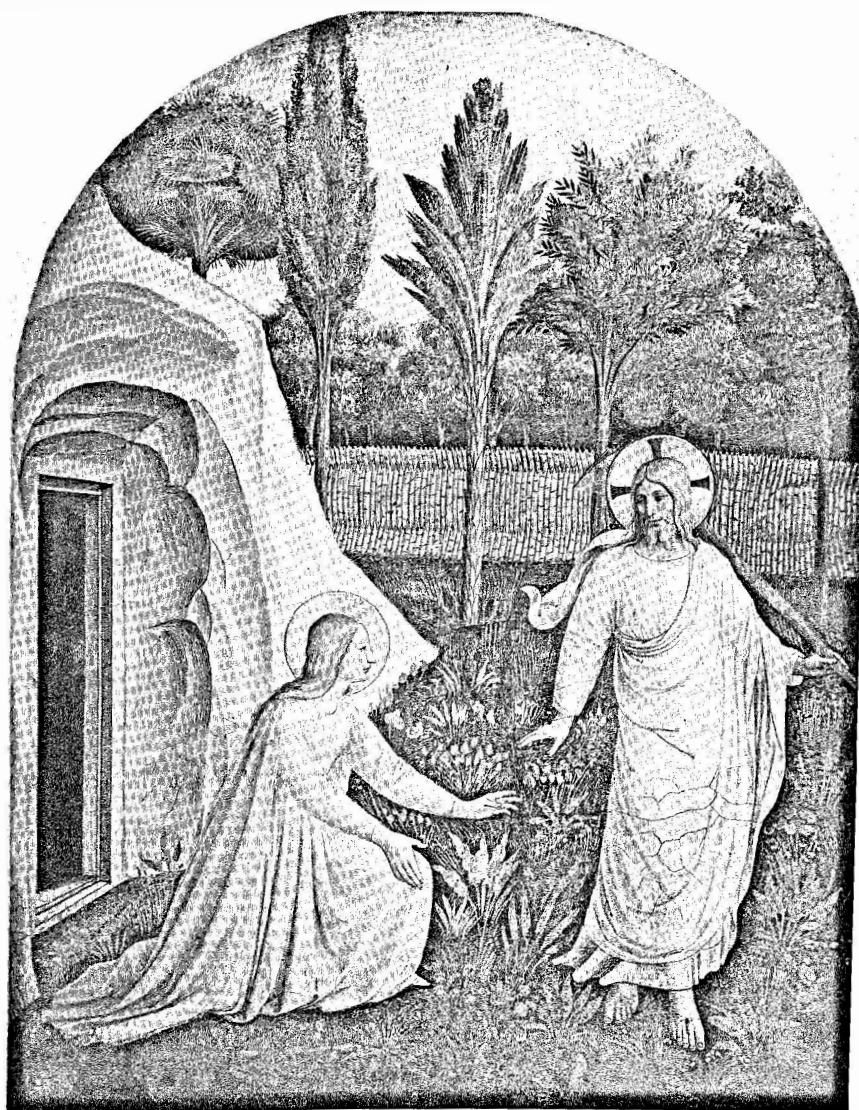
Maria von Magdala begegnet dem Auferstandenen

Eine theologische Bildbetrachtung zum 550. Todestag von Fra Angelico