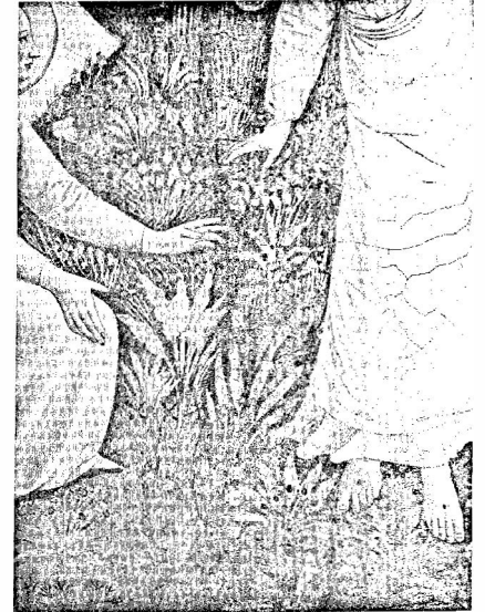
Blumen und Wunden: rot-weiße Farbtupfer

Zu tun haben wir es also mit einer Zeichenverschiebung. Man kann nicht mit Sicherheit sagen, was genau die Flecken sind: Blumen oder Stigmata. Diese ikonographische Verschiebung von der Blume hin zum Wundmal - und umgekehrt! - wird Fra Angelico sicherlich nicht „einfach so“, quasi bewusstlos und ohne Sinn, gemalt haben. Eher ist zu vermuten, dass mit den verschobenen Zeichen eine Mehrdeutigkeit der Repräsen-