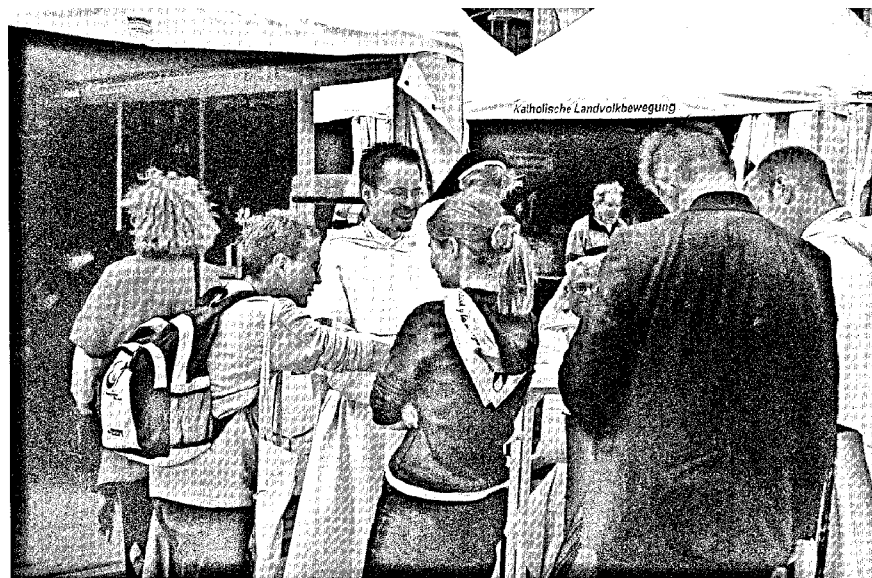
Der Stand der dominikanischen Familie

Uns, die wir „Gerechtigkeit vor Gottes Angesicht“ suchen, verweisen die Frauen und Männer in Abschiebehaft auf einen konkreten Ort der Unge-