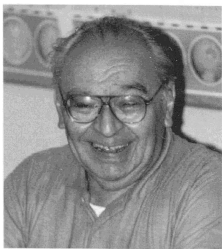
Gustavo Gutiérrez OP

Dem Befreiungstheologen Gustavo Gutiérrez OP zum 80. Geburtstag