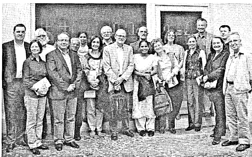
CONCILIUM-Herausgeber/-innengremium zusammen mit den Mitarbeitern des Institut M.-Dominique Chenu, Berlin

Diskurs – Vermächtnis – Engagement – Herausforderung