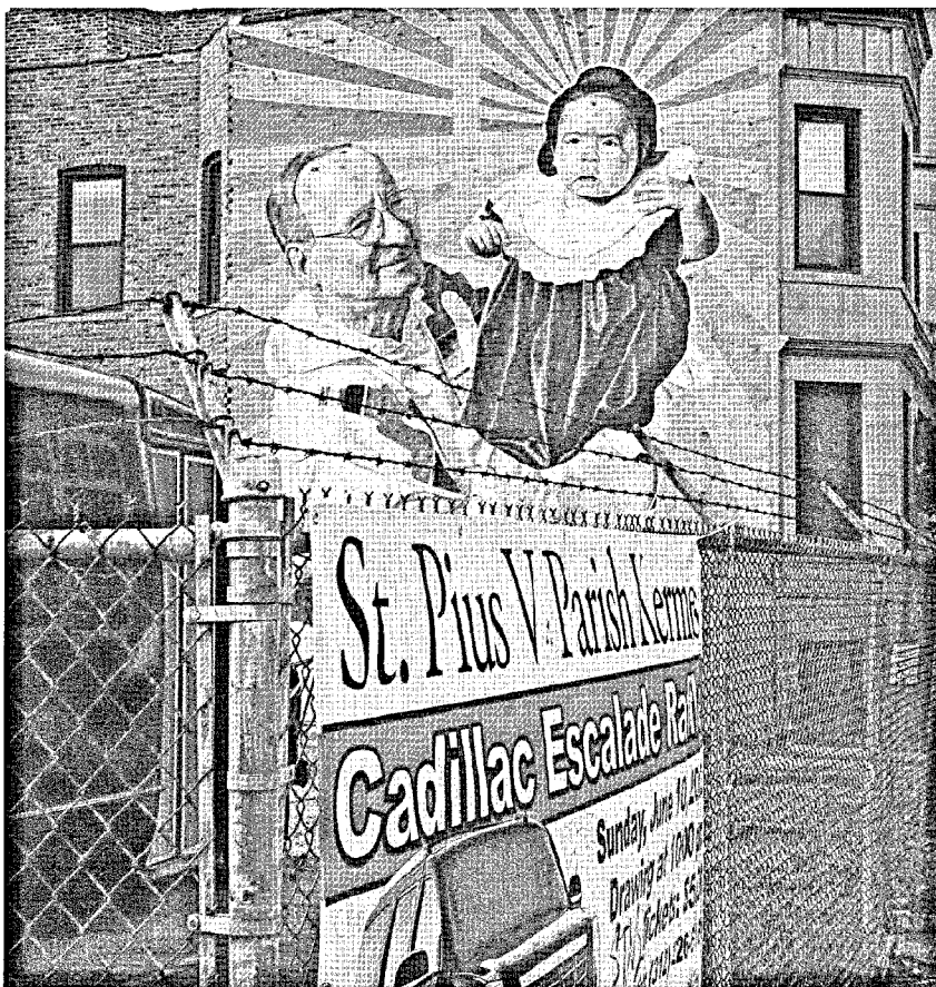
Gemeinde St. Pius V., Chicago

Theologisch interessierte Einblicke in das religiöse Innenleben der USA