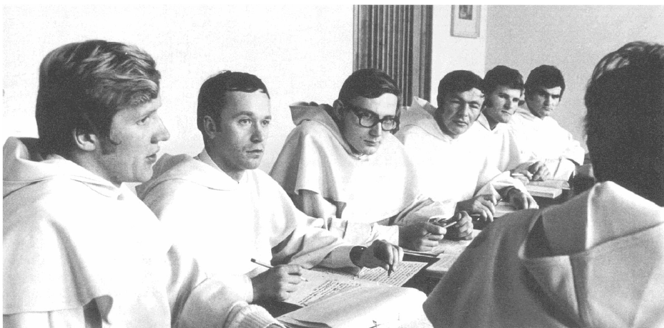
Vorlesung im Seminarraum in Walberberg in den 60er Jahren

Teil 3: Mannes Dominikus Koster OP (1901 – 1981)