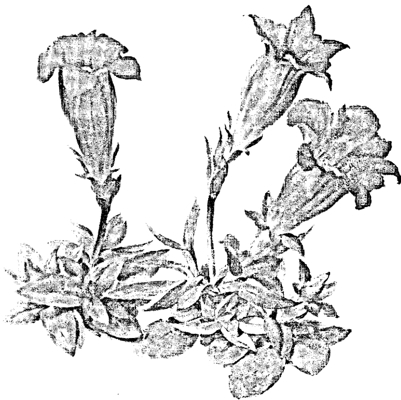
Kalk-Glockenenzian (links und Mitte) ( Gentiana clusii Perr. et Song.) Kiesel-Glockenenzian (rechts) ( Gentiana kochiana Perr. et Song.)

oben. Nichtswird mehr gefürchtet als Langeweile. Die Hoffnung auf erlebnisreiche Wochenend-, Feier- und Urlaubstage ist darum auch fester Bestandteil kollegialer Verabschiedungen am Arbeitsplatz. Die