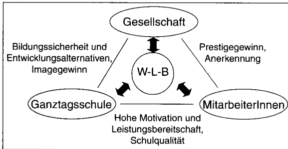
Abb. 2 Work-Life-Balance: Vorteile aus Sicht der Ganztageschule, der Gesellschaft und der MitarbeiterInnen.