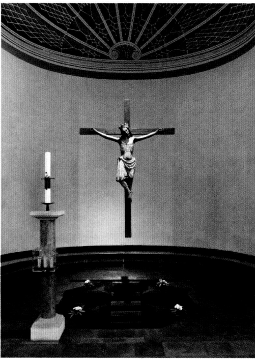
TAUFBECKEN IN ST. MARIA MAGDALENA, BOCHUM-HÖNTROP, ROLF GRUNDMANN, 2000