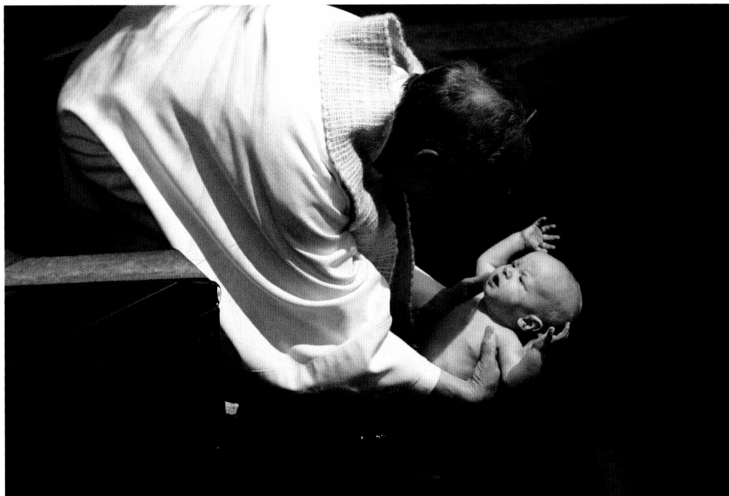
TAUFE EINES KINDES IN ST. MARIA MAGDALENA, BOCHUM-HÖNTROP

ser“ nicht auf eine Wandlung des Wassers abzielen, sondern auf die Menschen, die jetzt an diesem Taufbrunnen durch die Taufe mit dem lebendigen Wasser das neue Leben empfangen dürfen. Es ist erfreulich, dass vereinzelt auch in der Erzdiözese München und Freising Taufbrunnen mit fließendem Wasser zu finden sind, so in der Taufkapelle der St.-Laurentius-Kirche von Emil Steffann aus dem Jahr 1962. Solche Taufbrunnen erlauben es, aus fließendem Wasser zu schöpfen und damit die Taufbewerber zu übergießen. In den „Allgemeinen Vorbemerkungen“ ( Praenotanda generalia ), die sowohl für die Erwachseneninitiation als auch für die Feier der Kindertaufe gelten, heißt es aber ausdrücklich: