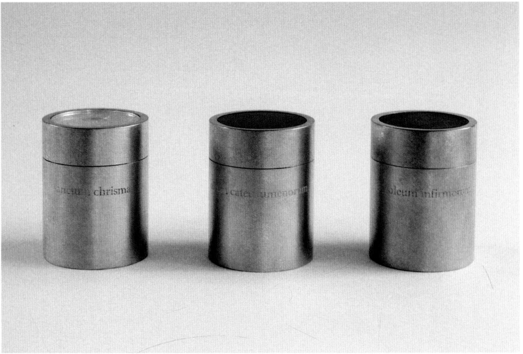
GEFÄSSE FÜR DIE HLL ÖLE, ST. PETER UND JOHANNES D. T., BERCHTESGADEN, LUTZENBERGER + LUTZENBERGER, 2015

ders deutlich bei der Taufe von unmündigen Kindern außerhalb der Messfeier, weil die dann meist kleineren Fei ergemeinden gemeinsam in Prozession von Ort zu Ort ziehen können. 3