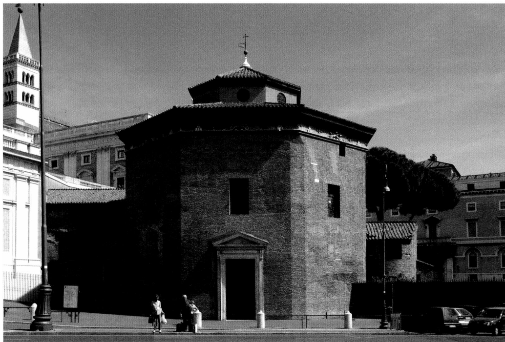
BAPTISTERIUM BEI ST. JOHANN IM LATERAN, ROM

bei Lebensgefahr des Taufbewerbers –, die Taufe nicht an beliebigen Orten zu feiern.