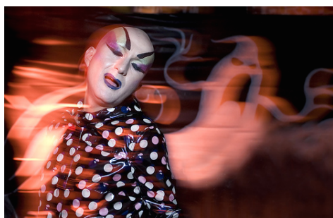
Diese kunstvolle Fotografie stammt nicht aus einem asiatischen Geisterfilm, sondern von einer Halloween-Parade in San Francisco 2007. Asiatische Horrorelemente sind längst global geworden. Die Kommentare auf der Webseite des Fotografen vergleichen die Aufnahme mit einer Kabuki-Performance.

Bildwissenschaft, Medienwissenschaft und Religionsästhetik in einen fruchtbaren Dialog treten zu lassen, ist gewinnbringend für alle Seiten. Der Geisterfilm in Südostasien ist im Übrigen ein bestens geeignetes Experimentierfeld genau dafür.