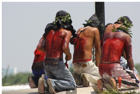
Wiederum San Fernando, Pampanga, diesmal Flagellanten an Ostern 2011.

Zuschreibung des Pathologischen. Niemand dort erklärt die Kreuzigerinnen und Flagellanten für verrückt.