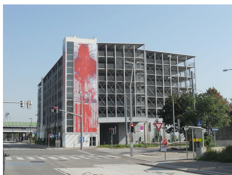
Eine der Aktionen von Künstler Hermann Nitsch bestand aus Schüttbildern, hier in vornehmlich roter Farbe an einem Parkhaus in Wien an der Donaumarina, aufgenommen 2012.

Wenn man über die Religionsgeschichte des Schmerzes spricht, darf der Hinweis auf Kunst und Unterhaltung nicht fehlen. Berühmt und berüchtigt sind Body-Art-Auftritte der Performance-Künstlerin Marina Abramovic , die sich u.a. auf der Bühne Schnittwunden beibringt, oder sich, nackt auf Eisblöcken liegend, fast zu Tode friert. Das blutige Orgien-Mysterien-Theater des Wiener Aktionskünstlers Hermann Nitsch ist ähnlich skandalisierend. Für beide Künstler sind die Zurschaustellung von Körper, Schmerz und Anspielungen auf die christliche Leidensgeschichte Skandalon und Markenzeichen zugleich. Das, was früher Mystiker anstrebten, nämlich Grenzüberschreitungen und Tabuverletzungen zum Zwecke der inneren Transformation, wird hier von Künstlern praktiziert.