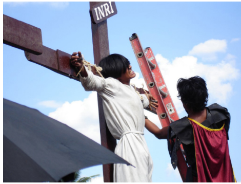
Kreuzigungsrituale zu Ostern 2008 in Pampanga auf den Philippinen.