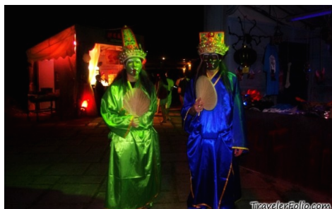
Im Jahr 2010 hatten die „Night Safari Halloween Horrors“ in Singapur das Thema „Spooky Tales of Asia“. Zum Programm gehörten auch diese beiden chinesischen „Höllengeister“.

Am südostasiatischen Geisterfilm faszinieren mich die dort eingekreisten Themen als Indikatoren für den rapiden Modernisierungsprozess: soziale und moralische Spannungen, der Wandel der Geschlechterrollen, urbane Vereinsamung, Auflösung der Familienbande, das Versprechen des schnellen Reichtums und die Versuchung der Kriminalität, enthemmte Gewalt, die Faszination der technischen Medien usw. Vor allem wird dabei aber auch die Jenseits-Hölle mit zeitgemäßen Bildern plausibilisiert. Geisterfilme sind immer auch post-mortem -Narrative und die Botschaft lautet: die Toten sind unter uns, Unrecht ist nicht vergessen, die Ahnen fordern ihr Recht. Besonders faszinierend ist die Beschäftigung mit Kino-Geistern in Südostasien, weil die genannten existenziellen Themen gleichzeitig auch an anderer Stelle verhandelt werden, nämlich im Tempel oder in der Kirche. An der Gegenwart und „agency“ von Geistern und der Notwendigkeit mit ihnen zu kommunizieren zweifelt niemand.