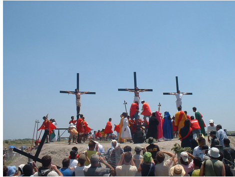
Kreuzigungsrituale in San Fernando, Pampanga, Philippinen, Ostern 2006.

Kurz: Die Beschäftigung mit christlichen Ritualen des Schmerzes ist immer auch schon positioniert. Wenn man mit ethnologischen Methoden auf den Philippinen dazu forscht, hat man vielfach ähnliche Probleme wie ein Religionshistoriker. Auch er sollte seine Zeitgeist-Positionierung reflektieren bevor er, beispielsweise, zum Fühlen und Denken der Menschen in Basel oder Nürnberg des 14. Jahrhunderts vordringen kann.