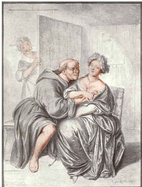
"Der lüsterne Mönch" gemalt von dem niederländischen Künstler Regner Brakenburg 1691.

Und schließlich kommt es in der europäischen Moderne zu einer interessanten Transformation des Affekthaushaltes. Manche Individuen erleben Schmerz am eigenen Körper als lustvoll oder empfinden Lust, wenn sie anderen Schmerz zufügen. Dieser Wandel wird deutlich greifbar an der Wende vom 17. zum 18. Jahrhundert. Interessanterweise werden, modern gesprochen, Sadismus und Masochismus als Phänomene zuerst ausführlich in Schriften beschrieben, die sich mit der Physiologie christlicher Selbstgeißelung befassen. Die Religionskritik des 18. Jahrhunderts greift das auf und zeichnet dann polemisch das Bild des lüsternen katholischen Geistlichen, der die Intimität der Beichte zur Befriedigung der eigenen Wollust missbraucht. Religionsgeschichte, Psychopathologie und die Geschichte der Sexualität greifen hier ineinander.