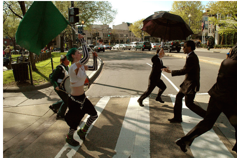
Nicht nur Proteste gegen die Weltbank wie hier im April 2005 in Washington D.C. inspirieren zur Inszenierung von vampiresken Outfits. Eine besondere Ausrichtung der Gothic Subkultur hatte sich bereits vor der Biss-Reihe in Buch und Film der edel scheinenden Untoten angenommen.

All das ist zunächst ein typisches Phänomen der westlichen Moderne. Die Figur des traurig-eleganten Aristokraten mit nadelspitzen Eckzähnen und unstillbarem Blutdurst hat keine Tradition im asiatischen Kino. Natürlich regt Hollywood mittlerweile an, auch dort Vampirfilme zu drehen und es gibt auch das eine oder andere hervorragende Beispiel. Etwa der Film DURST des Koreaners Park Chan-wook (2009), in dem übrigens ein katholischer Priester zum Vampir mutiert und in mehrfache moralische Dilemmata gerät. Der Vampirfilm ist allerdings eher die Ausnahme im ost- und südostasiatischen Kino.