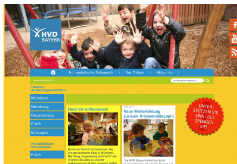
Screenshot der Startseite von hvd-kitas.de , 16. Juli 2014.

Was darüber hinaus an praktischen Angeboten mit weltanschaulichem, humanistischem Fundament angestrebt wird, können am ehesten die Vertreter der unterschiedlichen Landesverbände sagen. Ich persönlich würde mich über die Fortsetzung der Entwicklung einer weltanschaulich profilierten Fest- und Feiertageskultur freuen und darüber, dass mehr Menschen, die hier im wohlhabenden Europa ohne Religion leben, die große Verantwortung erkennen, die sie aus globaler Perspektive haben.