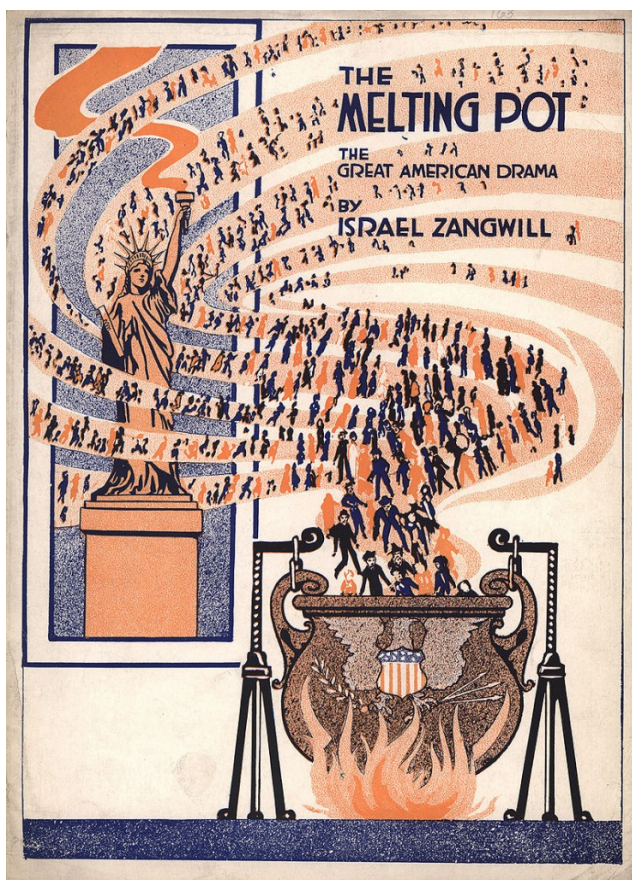
“The Melting Pot” war auch der Name eines Theaterstückes von Israel Zangwill (1908). Der Protagonist David Quixano erlebte als Angehöriger einer jüdischen Minderheit im zaristischen Russland einen Pogrom, und Amerika als “Schmelztiegel” gibt ihm Hoffnung auf eine zukünftige Gesellschaft frei von Rassismus und Hass. Das Theaterstück popularisierte diese Versinnbildlichung Amerikas. Die Freiheitsstatue auf dem Theaterplakat verweist direkt auf New York.

Im Jahr 2011 erschien das Buch “Open City” von Teju Cole. Der als Obayemi Babajide Adetokunbo Onafuwa in den USA geborene und teilweise in Lagos aufgewachsene Schriftsteller, Fotograf und Kunsthistoriker lässt darin den Protagonisten Julius mit vergleichbaren Migrationserfahrungen, von Beruf aber Psychiater, durch New York der Jahre 2006, 2007 spazieren (mit Ausnahme der Kapitel 7-11, welche in Brüssel spielen). In einem Interview mit Ekkehard Knörer (Merkur, 2012) sagt Cole, “ich wusste, dass es um diesen Zustand nach 9/11, um die Nachwirkungen dieses Ereignisses und dieser Verluste ging. Wir haben ja einfach weitergelebt, aber es blieb etwas Unabgeholtes, Unabgeltbares...”. Es geht dabei also auch um eine Selbstverortung einer Stadt wie New York (oder aktuell Paris) im Angesicht eines islamistischen Terrors (vgl. dazu Der Salafismus und die dschihadistische Idee ).