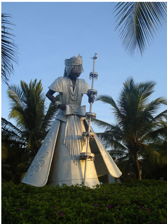
Obatala ist in der Religion der Yoruba, in der kubanischen Santería und im brasilianischen Candomblé diejenige Schöpfergöttheit, welche die Menschen aus Lehm geformt oder aus Metall gegossen hat (nach Wikipedia). In Ile-Ife in Nigeria hat Obatala einen Tempel. Dort findet regelmäßig ein Jahresfest zu Ehren des Gottes oder Orisha statt. Das Bild zeigt eine Statue von Obatala in Costa do Saúpe, Brasilien.

Der narrative Stil lässt sich mit einem Beispiel (S. 37-43, dt. Übersetzung, 2. Auflage 2014) erläutern: 1. Auf die Begegnung mit einem „Krüppel“ folgt eine Assoziation in Richtung Yoruba-Religion: "Mir kam der Gedanke, dass möglicherweise Obatala seine Finger im Spiel hatte, der Schöpfergott, der im Auftrag von Olodumare die Menschen aus Lehm formte. [...] Die Yoruba glauben, dass Obatala im Vollrausch Zwerge und Krüppel, Menschen mit fehlenden Gliedmaßen und chronisch Kranke produzierte". 2. Erst jetzt wird der Zweck seiner aktuellen Fahrt mit der Linie 1 eingeführt, ein Kinobesuch. Vor diesem will er etwas "Zeit tot[.]schlagen" in einer Buchhandlung, es geht um "The Monster of New Amsterdam", "eine historische Biographie von einer meiner Patientinnen" über Cornelis van Tienhoven (17. Jh.). Ihm und der Patientin sind jetzt mehrere Seiten gewidmet. 3. Den Weg von Buchhandlung zum Kino begleiten Gedanken über die kleine Eiszeit, Klimawandel-Skeptiker und „eine Art antiwissenschaftliche Laune“ (S. 42). 4. An der Kinokasse erfährt man, dass der Film in Afrika spielt. Im folgenden Abschnitt wird allmählich verraten, es handelt sich um „ Der letzte König von Schottland “ (2006) – gemeint ist Idi Amin Dada, „Diktator von Uganda in den Siebzigerjahren“.