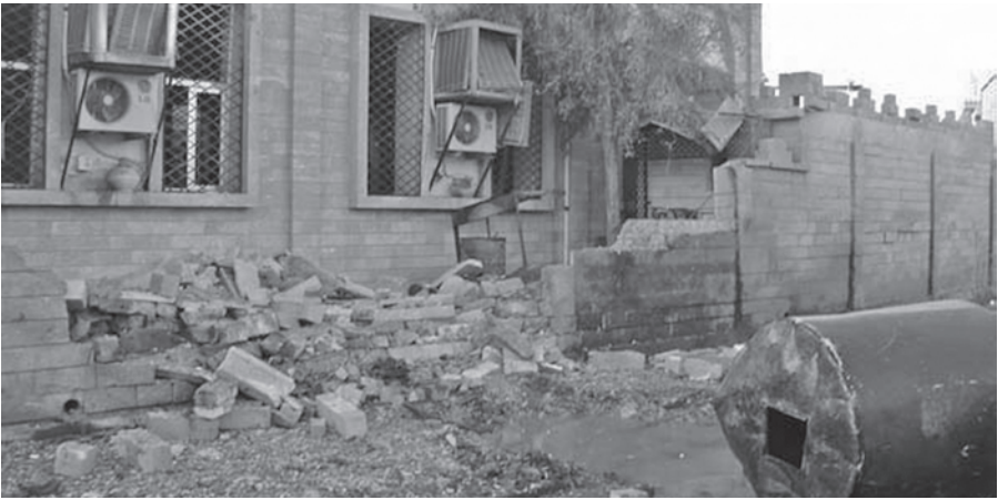
Baghdad, Stadtteil Ghadir: Am 06.02.2008 – dem orthodoxen Weihnachtsfest bzw. dem Dreikönigstag des Gregorianischen Kalenders – wurden zwei Kirchen und ein Frauenkloster zeitgleich mit Sprengstoff und Mörsergranaten angegriffen.

Jahr 2000 derzeit sogar noch zu. 48 Die Zahl der Christen selbst nimmt allerdings ebenfalls zu (größtenteils aufgrund der Abwendung von einem im Iran brutal erscheinenden und manchen enttäuschenden Islam), wobei zugleich sehr viele auswandern. Nach den Zahlen des ICI gab es 1990 weltweit 16.000 protestantische, exiliranische Christen, 1994 36.000 und 1999 55.000, die Hälfte davon sind demnach Konvertiten aus dem Islam, die andere Hälfte aus anderen religiösen Minderheiten oder aus christlichen Familien. 49