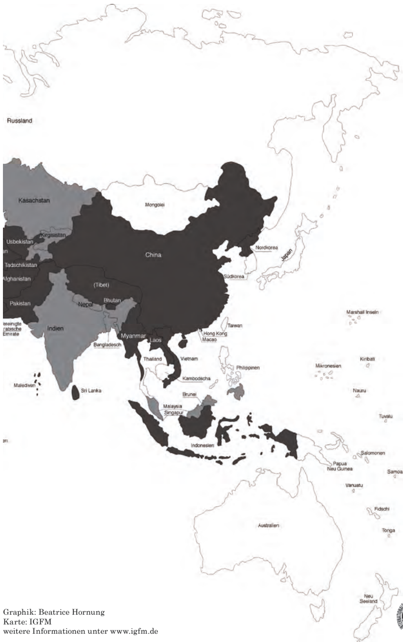
Graphik: Beatrice Hornung Karte: IGMF weitere Informationen unter www.igfm.de