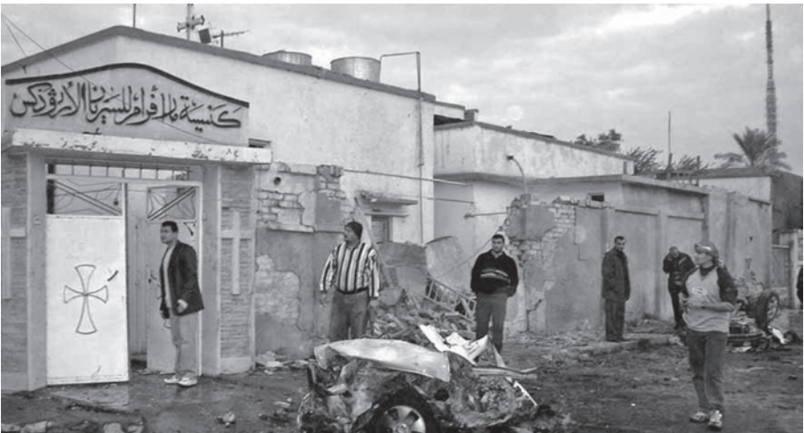
Irak: Der größte Teil der irakischen Christen ist aus ihrer Heimat geflohen. Erpressungen und gewalttätige Übergriffe gegen Christen sind an der Tagesordnung. Das Bild zeigt die syrisch orthodoxe St. Afrem Kirche im Bezirk Al-Ummal, Kirkuk, im Norden des Irak nach einem Autobombenanschlag am 9. Januar 2008.

Die Rückbesinnung auf den Islam und die Bestrebungen zur Umsetzung der Scharia, dem islamischen Rechtssystem, schreitet seit Jahren voran. Die barbarische Konsequenz, mit der die Taliban (Koranschüler) in Afghanistan und Pakistan, oder die Union der Schariagerichte in Somalia die Scharia durchsetzen wollen, ist selten. Der totalitäre Charakter aber, mit dem der politische Islam in zahlreichen Staaten der Erde praktiziert wird, ist dagegen verbreitet. Ganz besonders deutlich wird das an den verschiedenen staatlichen Religions-Polizeinheiten, wie es sie in Saudi-Arabien, im Afghanistan Karsais oder in Nordnigeria gibt. Daneben existiert eine Reihe von nichtstaatlichen Gruppen, die ihre Vorstellungen von „Tugend“ mit Gewalt erzwingen und „Sünde“, wie z.B. die Verbreitung des Evangeliums, mit aller Härte bekämpfen.