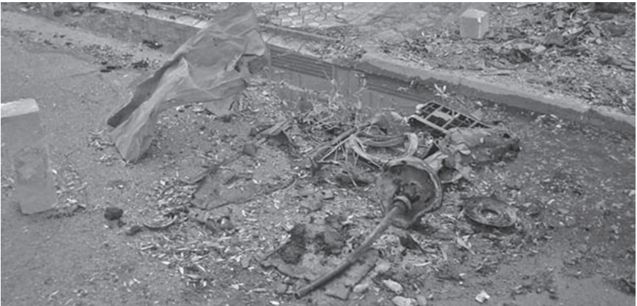
Überreste des Anschlags, vom 06.02.2008, vor der chäldischen Mar Gorgis Kirche in Bagdad, im Stadtteil Ghadir.