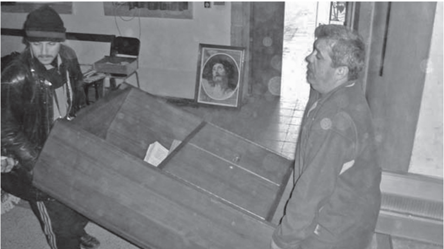
Aufräumarbeiten nach einem Anschlag durch Sprengstoff und Mörsergranaten auf die Mar Gorgis Kirche in Bagdad, im Stadtteil Ghadir.

In der sunnitischen und schiitischen Rechtswissenschaft besteht weitgehend Einigkeit darüber, dass der Abfall vom Islam mit dem Tod bestraft werden muss. Ausnahmen von diesem Grundsatz gibt es lediglich für Sonderfälle wie z.B. bei Kindern oder Geisteskranken. Der Abfall vom Islam ist ein sogenanntes hadd-Delikt (wörtlich „Grenzvergehen“). Dabei handelt es sich nach islamischer Auffassung um „Verbrechen“, die der Koran oder die Überlieferung (Sunna) mit einem bestimmten Strafmaß belegen.