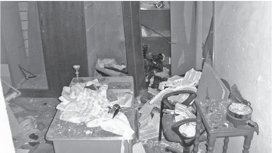
Bei den Anschlägen am 6.02.2008 in Bagdad wurde im Stadtteil Ghadir, beim orthodoxen Weihnachtsfest, ein Kirchenwächter verletzt.