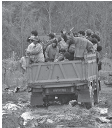
Rettung der Montagnards aus dem kambodschanischen Dschungel.

Die Situation der Montagnard-Flüchtlinge war zeitweise alarmierend. Denn mangels eines funktionierenden internationalen Flüchtlingsschutzsystems mussten sie sich aus Angst vor einer Auslieferung monatelang in den Wäldern verstecken – geplagt von tropischen Krankheiten und Hunger. Erst nach zähen Verhandlungen mit der kambodschanischen Regierung konnte das UNHCR zwischen Juli und Dezember 2004 rund 800 erschöpfte Montagnard-Flüchtlinge