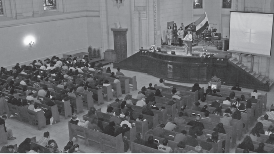
Eine Gebetsversammlung in der Kasr el Dobara Kirche in Kairo.

zugelassen: Muslim, Christ, Jude. Während der Wechsel zum Islam unproblematisch ist, weigern sich die Behörden, bei Konvertiten aus dem Islam in eine andere Religion den Eintrag entsprechend zu ändern.