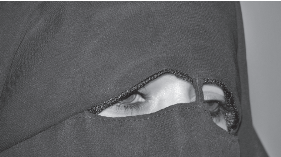
Ägypten: Ehemalige Muslima, die Christin wurde. Ihre Identität muss sie geheimhalten, Juli 2008.

Auf den Straßen Kairos, der bevölkerungsreichsten Stadt der arabischen Welt, herrscht für den Ägyptenbesucher vermeintliches Chaos: Hupende Autos, Taxen und Busse schlängeln sich, meist knatternd, aneinander vorbei. Abgase hängen in der Luft. Verkehrsregeln werden frei interpretiert, weitere Fahrspuren spontan eröffnet. Aus dem heruntergelassenen Fenster verständigen sich lautstark und gestenreich die Fahrer über einen Fahrbahnwechsel oder darüber, wer die Schuld am abgefahrenen Spiegel oder Rücklicht trägt. „So, ich sehe, ihr habt den Verkehr überlebt.“ – Reiseleiter Anis* schmunzelt, als er die deutsche Gruppe empfängt und in ein Restaurant führt. Der Ägypter gehört zu einer großen evangelikalen Gemeinde in Kairo und ist landesweit in kirchlichen Diensten aktiv. Unzählige Geschichten von Christen in Ägypten kann er erzählen, die das Schattensdasein der Kirche in seiner Heimat beschreiben. Er liebt sein