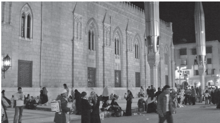
Abendszene vor der Husseinmoschee, Kairo.

Quelle: Helmut Moll, Martyrium und Wahrheit. Zeugen Christi im 20. Jahrhundert (Weilheim – Bierbronn, 3., aktualisierte Auflage 2007) 203–210.