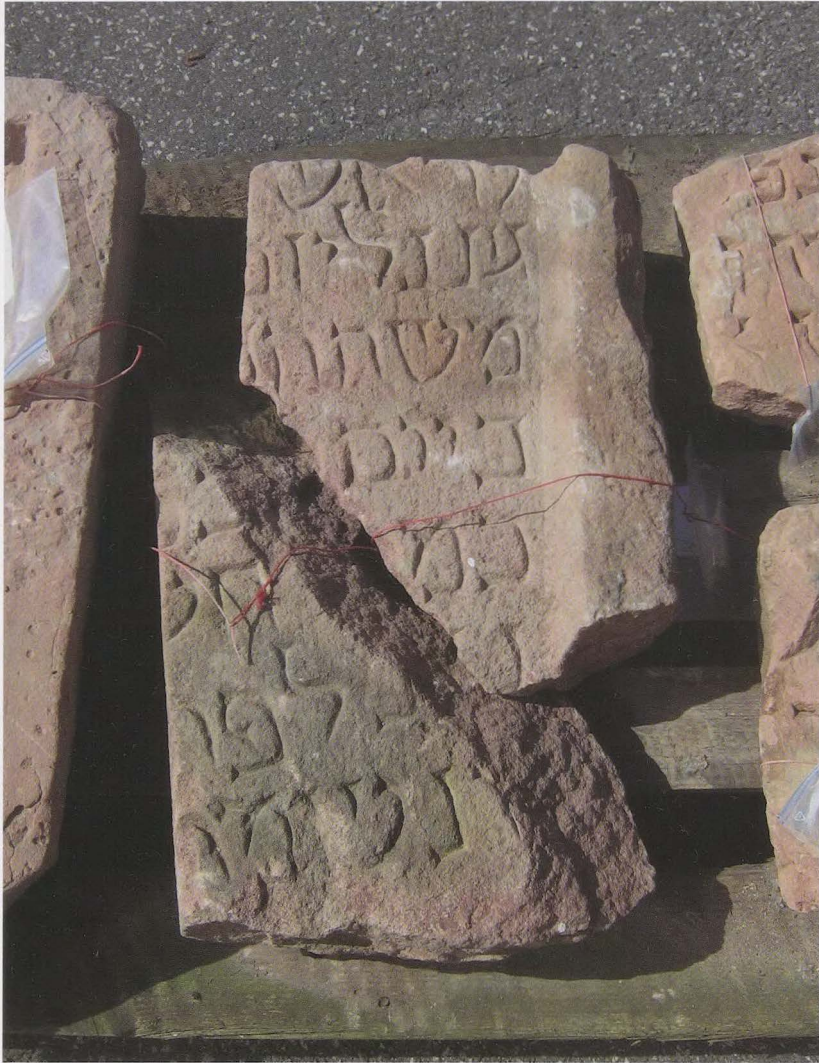
1 Oberursel-Bommersheim. Jüdischer Grabstein der 1292 verstorbenen „Gutlin“ oder „Gitlin“ von der Grabung im Jahr 2009 aus Schnitt 3, Befund 68 (Grab-/Werksteine Nr 3, Steinfragmente 4 a+b)

über die römische Zeit bis in das frühe Mittelalter vor allem wegen seiner Anbindung an das spätantike Straßennetz genutzt. Die erste Namensnennung stammt aus dem Lorscher Codex von 792. Bereits im 11./12. Jahrhundert entwickelte sich eine Motenanlage, die von Gräben umgeben war; hieraus ging nach und nach eine steinerne Burganlage mit einem Wehrturm hervor. Definitiv archäologisch nachweisbar wird die Burg erst im 13. Jahrhundert. Von nun an waren die Bewohner der Burg Ministeriale, also Amtadel, der wahrscheinlich aus dem Geschlecht der Schelme von Bergen abstammte. Sie nannten sich jetzt nach ihrem Wohnsitz Bommersheim. Ab dem 14. Jahrhundert veränderte sich die soziale Situation des niederen Adels, sodass sich aus dem ehemaligen Amtadel über die Erblehen ein Familienbesitz bildete. Dies kollidierte zunehmend mit dem Selbstbewusstsein und dem Selbstverständnis der sich emanzipierenden Stadtbürger, die Wohlstand schafften und vermehrten – insbesondere in Frankfurt a. M. Einher ging damit eine Verarmung des niederen Adels, aber auch ein zunehmender Machtverlust der Zentralgewalt. Die Ritter hatten hierdurch Gelegenheit, ihren sozialen Aufstieg selbst in die Hand zu nehmen. Vor diesen sich verändernden gesellschaftlichen Bedingungen ist