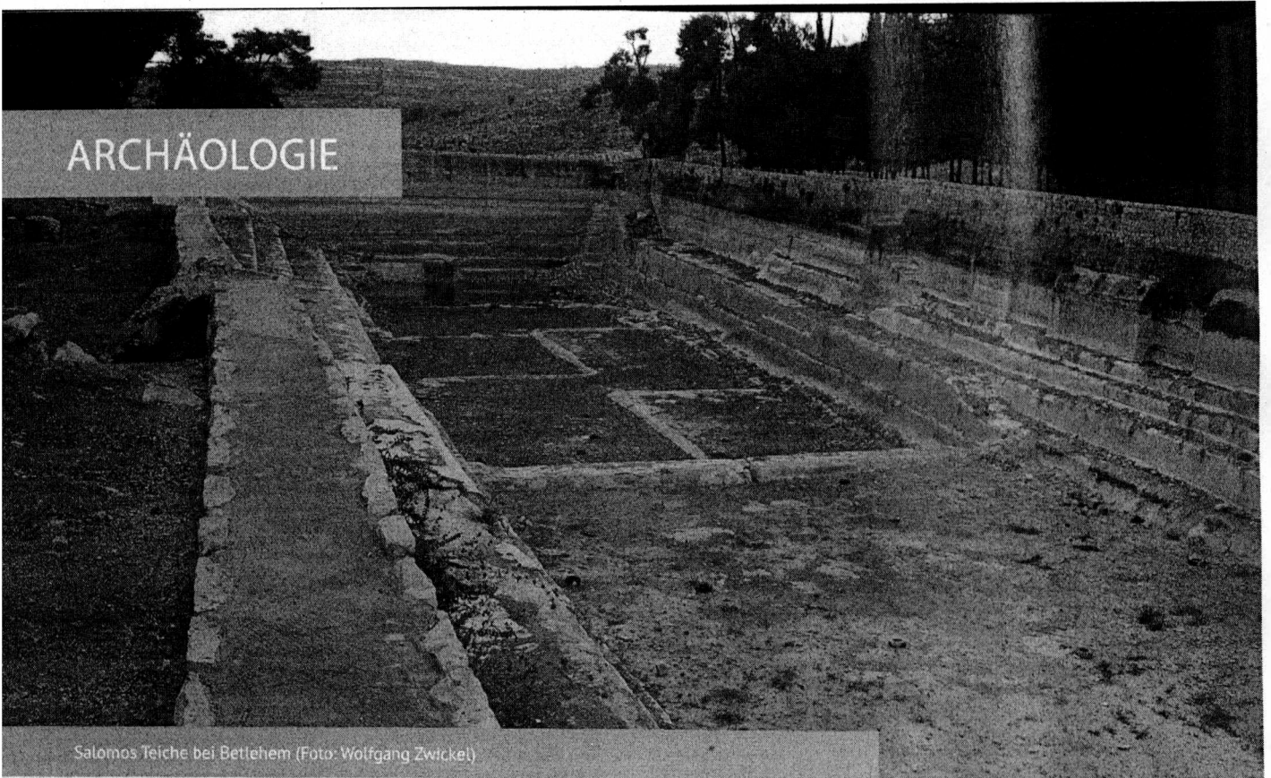
Salomos Teiche bei Betlehem