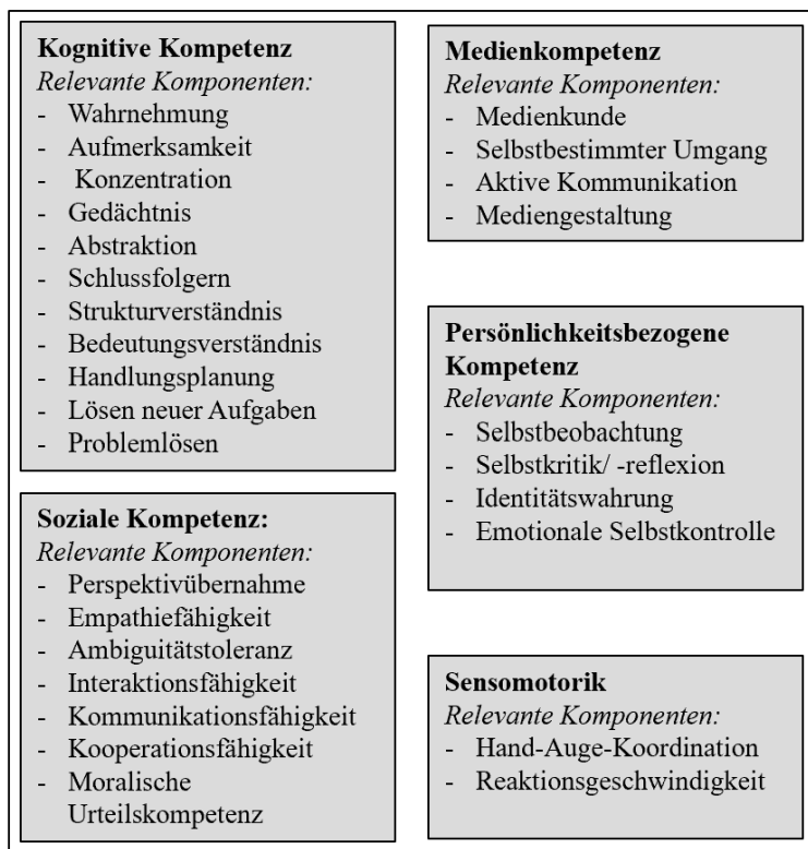
Abb. 2: Überblick über die potenziell durch digitale Spiele förderbaren Kompetenzen

Neben den eben aufgeführten motivationalen Potenzialen digitaler Spiele, können durch das Spielen die Fähigkeiten der Lernenden erweitert werden. Diese überschneiden sich zum Großteil mit den oben aufgeführten Kompetenzen, welche in gewissem Maße auch als Voraussetzungen für den lernförderlichen Einsatz angesehen werden können (Arndt, 2013; Gebel et al., 2005) (vgl. Kap 4.2.3). Aus diesem Grund wird hier lediglich eine Übersicht über alle förderbaren Kompetenzen angeführt, bevor auf vereinzelt genauer eingegangen wird (siehe Abbildung 2). Die in Abbildung 2 aufgeführten Kompetenzen können durch das reine digitale Spielen erreicht werden, ohne dass weitere Maßnahmen wie Reflexionen durchgeführt werden (Gebel et al., 2005).