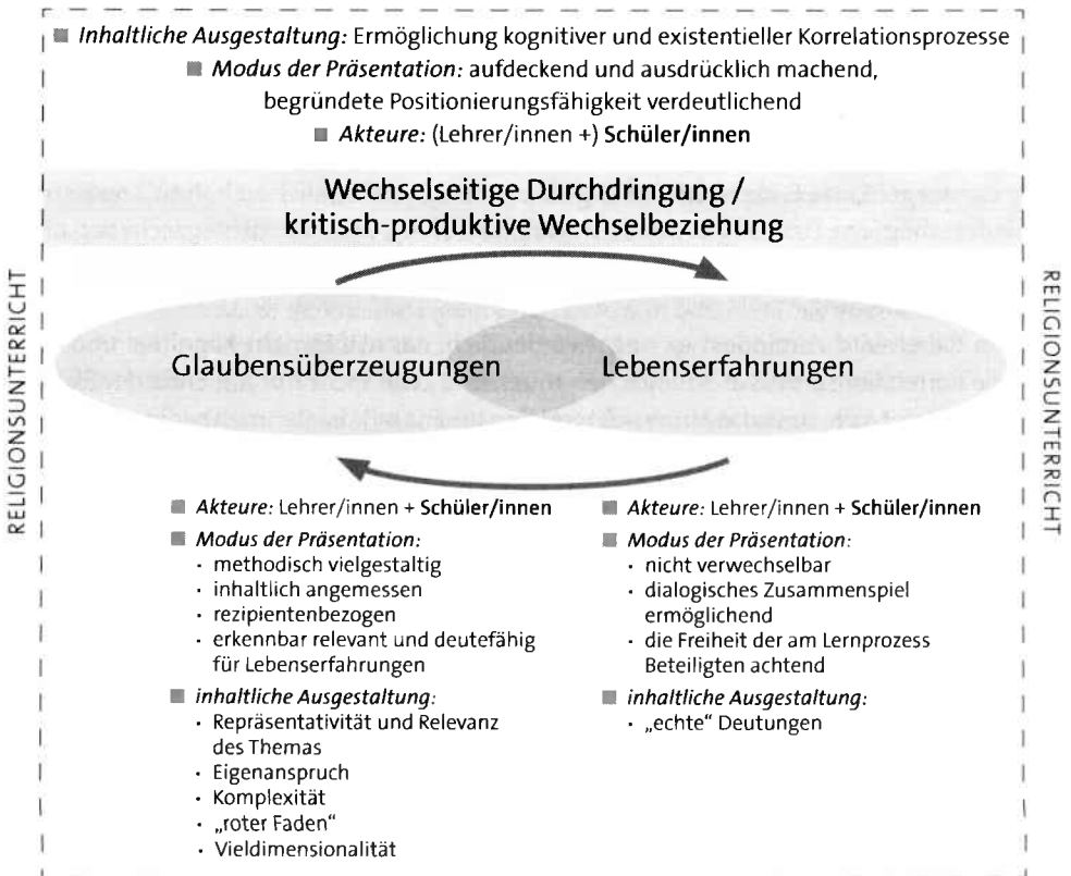
Abb. 4: Kriteriologie gelingender Korrelationsprozesse

Eine Kriteriologie gelingender Korrelationsprozesse ließe sich graphisch insofern folgendermaßen darstellen: