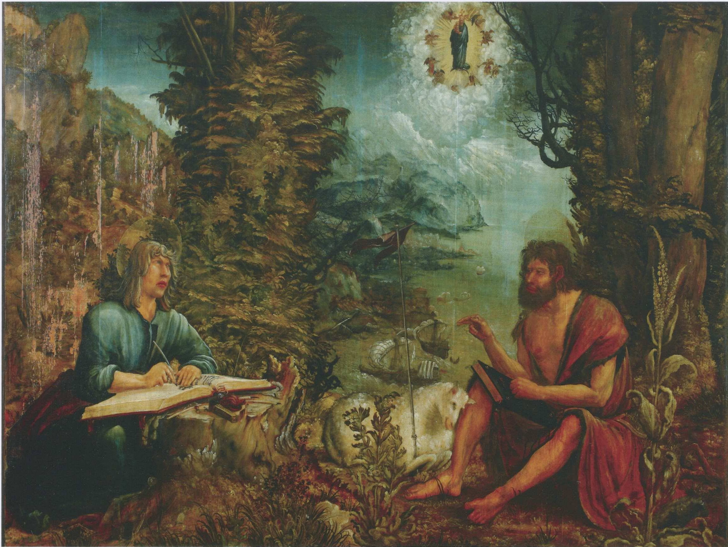
2 Albrecht Altdorfer, Die beiden Johannes , um 1507, Öl auf Lindenholz, 135 × 174,5 cm, Museen der Stadt Regensburg, Leihgabe des Katharinenspitals

immer mehr zu einem Instrumentarium der Seelsorge auch an Laien ausgebaut: 1215 versuchte ein Konzil erstmals, diese für alle Laien verpflichtend zu machen. 20 Gerade die Mendikanten propagierten sie nun, die auch die Experten für die wenig später sich ausbildende Inquisition wurden. Beichte und Inquisition zielten ebenfalls auf individuelle Gewissensbildung, aber auch auf Kontrolle des Glaubens und auf Distinktion zu heterodoxen Strömungen. 21 Bruderschaften, Wallfahrten und Ablässe wurden von den Mendikanten vielfach propagiert, um laikale Gruppen intensiver zu formen und zu leiten.