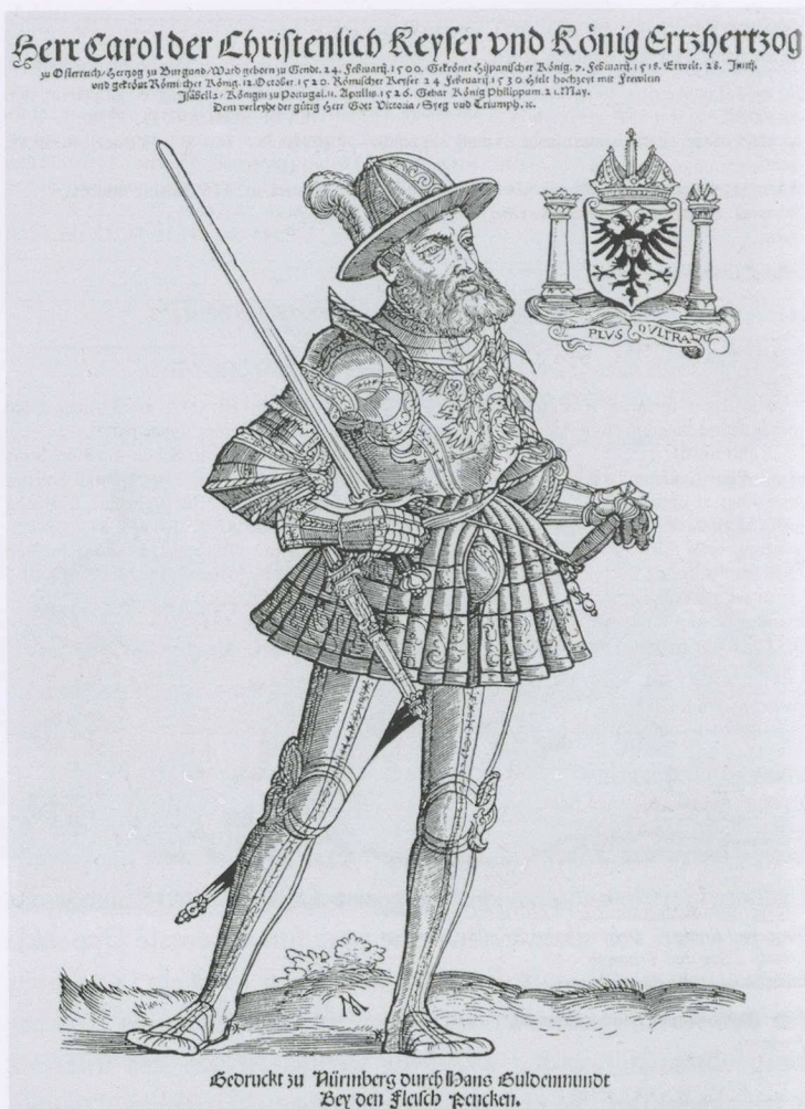
5 Michael Ostendorfer, Kaiser Karl V. (Herr Carol der Christenlich Keyser und König Ertzhertzog ...) , um 1548, Holzschritt, 36,8 × 28 cm, Stiftung Schloss Friedenstein Gotha