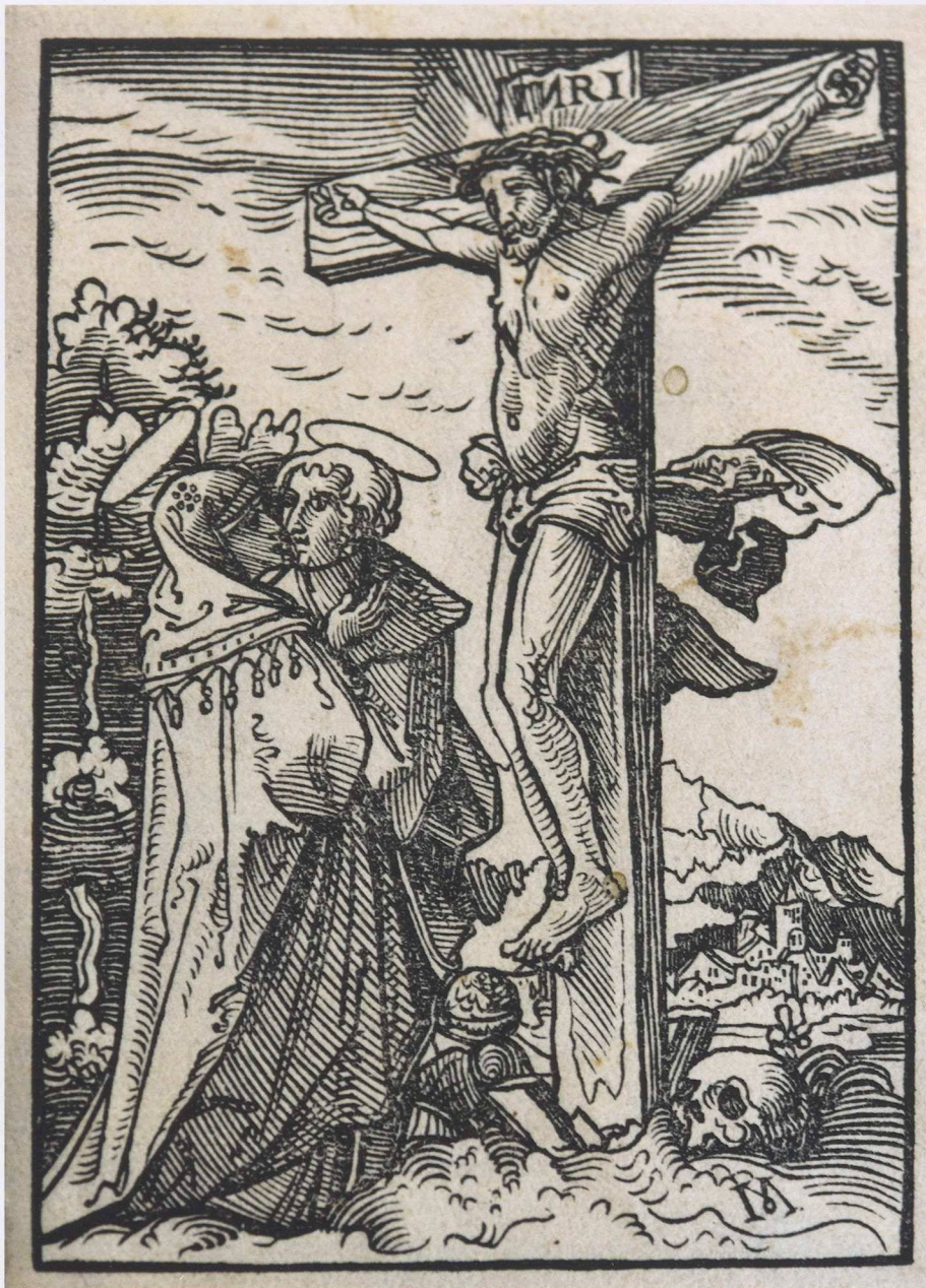
3 Michael Ostendorfer, Kreuzigung Christi , Illustration aus der Christlichen Auslegung der Evangelien des Johann von Eck, 1530, Holzschnitt, 9,2 × 6,4 cm, Museen der Stadt Regensburg

Beschneidung seiner Einnahmeforderung und zu besserer Bildung notfalls gezwungen werden, um den Anhängern Luthers die Argumente zu nehmen.