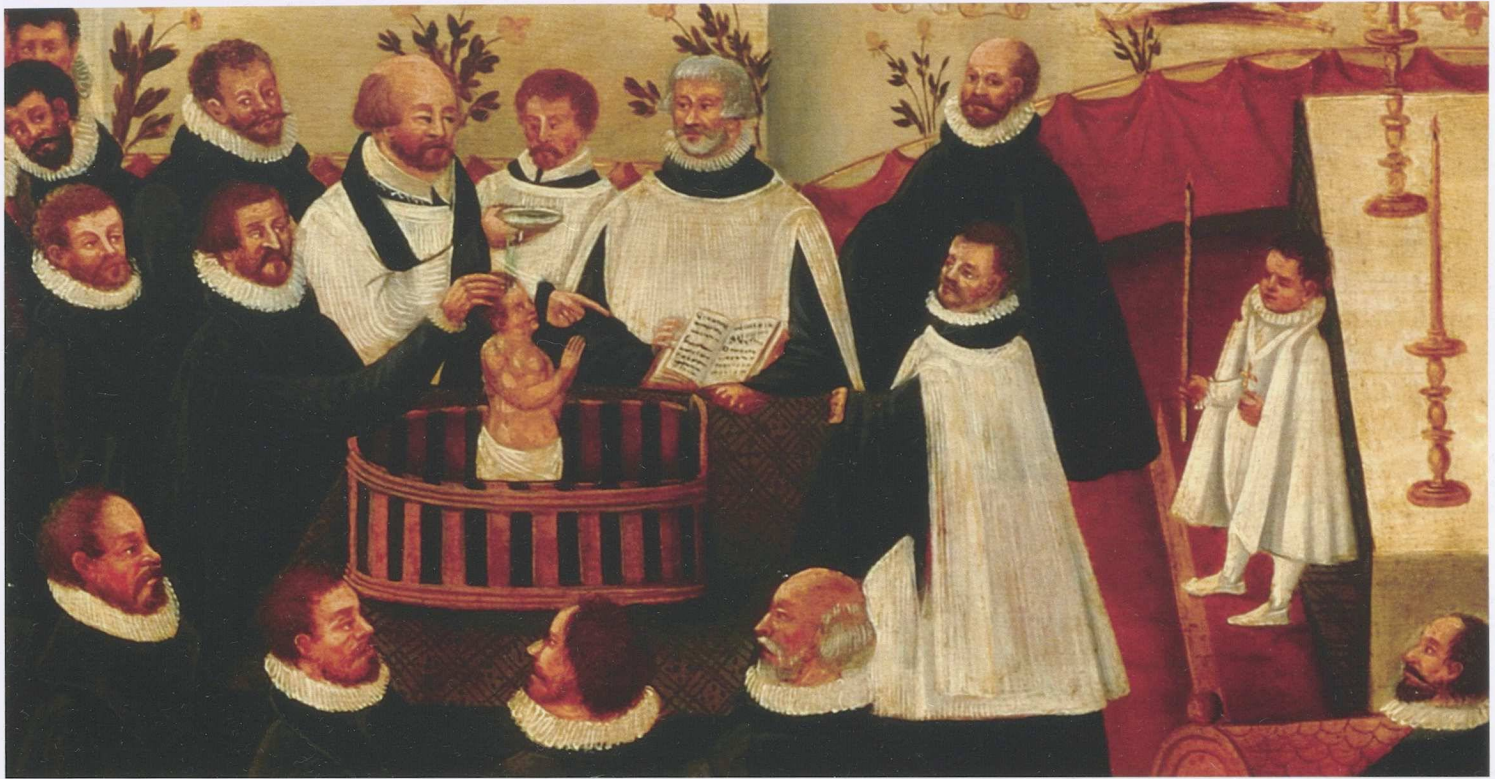
6 Detail aus: Anonym, Evangelische Taufe in einer Regensburger Hauskapelle , Öl auf Laubholz, 71 × 62 cm, Museen der Stadt Regensburg

daran, aus Regensburg ein streng lutherisches, gottwohlgefälliges Gemeinwesen zu machen und den Zorn Gottes abzuwenden, wozu ihm nicht zuletzt die Kirchenzucht mit der Einzelbeichte diente. 113