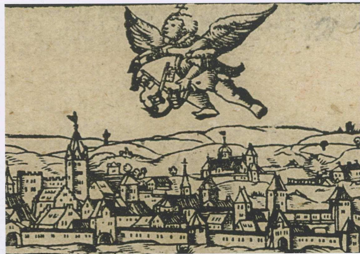
7 Detail aus: Michael Ostendorfer, Zwei Stadtansichten Regensburgs von Norden mit Probedrucken , 1552–1553/58, Holzschnitt, 20,5 × 31,6 cm, Museen der Stadt Regensburg

Gerade in der Stadt Regensburg besaß der Bischof sehr wenig Rechte. Die dortigen Stifte und Klöster folgten ihren eigenen Traditionen und hatten die weitgehende Unabhängigkeit vom Bischof längst erstritten. Sie folgten im 16. Jahrhundert den Gesetzen des Herkommens und hatten wenig Anlass, von sich aus die Trienter Reformen zu propagieren. Entscheidend musste deshalb hier die Ansiedlung neuer Ordensgemeinschaften sein. Immerhin wurde in der zweiten Hälfte des 16. Jahrhunderts die Domkanzel zum Ausgangspunkt jesuitischer, ›gegenreformatorischer‹ Kontroverspredigt in der Stadt. Intensiv bemühte sich der Administrator für den minderjährigen Wittelsbacher Philipp Wilhelm (1579–1597), der Germaniker Dr. Jakob Miller (1550–1597), seit 1586 für die Reform und protegierte die Auflösung des Kanonissenstifts St. Paul 1588 zugunsten eines Jesuitenkollegs. 127 Weitere neue nachtridentinische Ordensgemeinschaften konnten aber erst unter dem Schutz der zunehmend ›gegenreformatorischen‹ Habsburger im 17. Jahrhundert errichtet werden, 1613 des Kapuzinerkloster St. Matthias und 1641 das Karmeliterkloster St. Joseph. 128