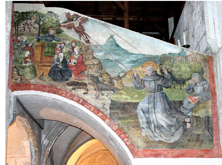
Fresko der Stigmatisation des hl. Franz von Assisi in St. Katharinen in Lübeck

Gleichsam in einer Gegenbewegung hat das westliche Christentum im Mittelalter eine besonders dramatische Form religiöser Körpermodifikation hervorgebracht: die „Stigmatisierung“. Hier entstehen in einem Prozess psychosomatisch wirksamer Identifikation mit Jesus Christus, dem gekreuzigten, dieselben Wundmale, an den Händen von Gläubigen, wie es die ikonographische Tradition der Kreuzigungsdarstellungen darstellt. Bei der römischen Kreuzigung wurde durch das Handgelenk genagelt, da die Hand das Gewicht des Körpers nicht tragen konnte, doch ist die Vorstellung von Wundmalen Christi an den Händen üblich geworden; entsprechend bilden sich die Wundmale der Stigmatisierten aus. Franz von Assisi ist der erste Heilige, von dem eine Stigmatisierung überliefert wurde, die 1224 stattgefunden haben soll. Die katholische Kirche beachtet dieses Phänomen zwar als spirituell relevant, wertet es jedoch nicht automatisch als Zeichen von Heiligkeit oder als „übernatürliches Geschehen“. Stigmatisierungen kommen im katholischen Raum bis in die Gegenwart vor.