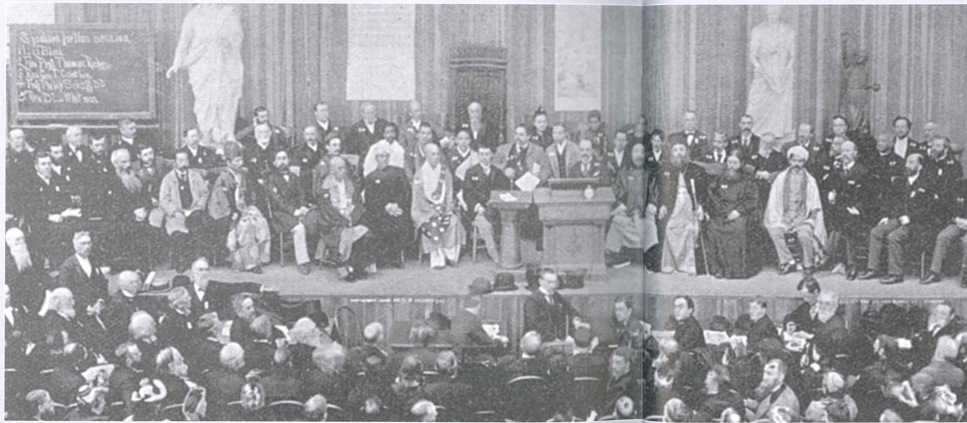
Vertreter der wichtigsten Religionen der Welt führen einen interreligiösen Dialog und repräsentieren die religiöse Vielfalt der Menschheit – Sitzung des Weltparlamentes der Religionen in Chicago im September des Jahres 1893.

Nicht eingeladen waren Mormonen und »native Americans« – also Indianer –, wie überhaupt die so genannten tribalen Religionen als »primitiv« abgewertet wurden. Der einflussreiche türkische Muslim Sultan Abdul Hamid II. verweigerte seine Teilnahme, so dass der Islam nur durch amerikanische Konvertiten vertreten war.