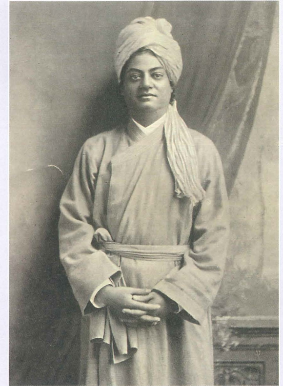
Swami Vivekananda – Vertreter des Hinduismus auf dem Weltparlament der Religionen und religiöser Mittler zwischen Ost und West

Die Popularisierung des Hinduismus und des Buddhismus im Westen ist eng mit dem Weltparlament von 1893 verbunden. Religionsvielfalt und die Wahrnehmung östlicher Religionen wurden damit zu einer viel diskutierten öffentlichen Angelegenheit. Das amerikanische Interesse an östlichen Religionen war zwar bereits durch die Theosophische Gesellschaft (gegründet 1875 in